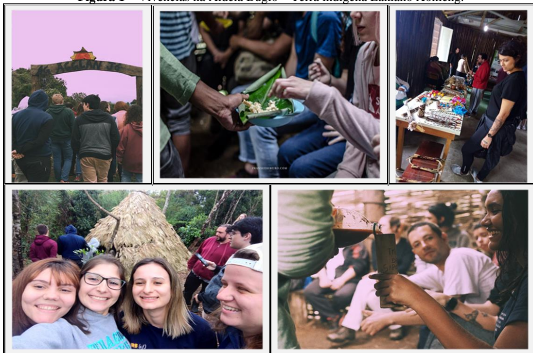
Figura 1 – Vivências na Aldeia Bugio – Terra indígena Laklanô Xokleng.