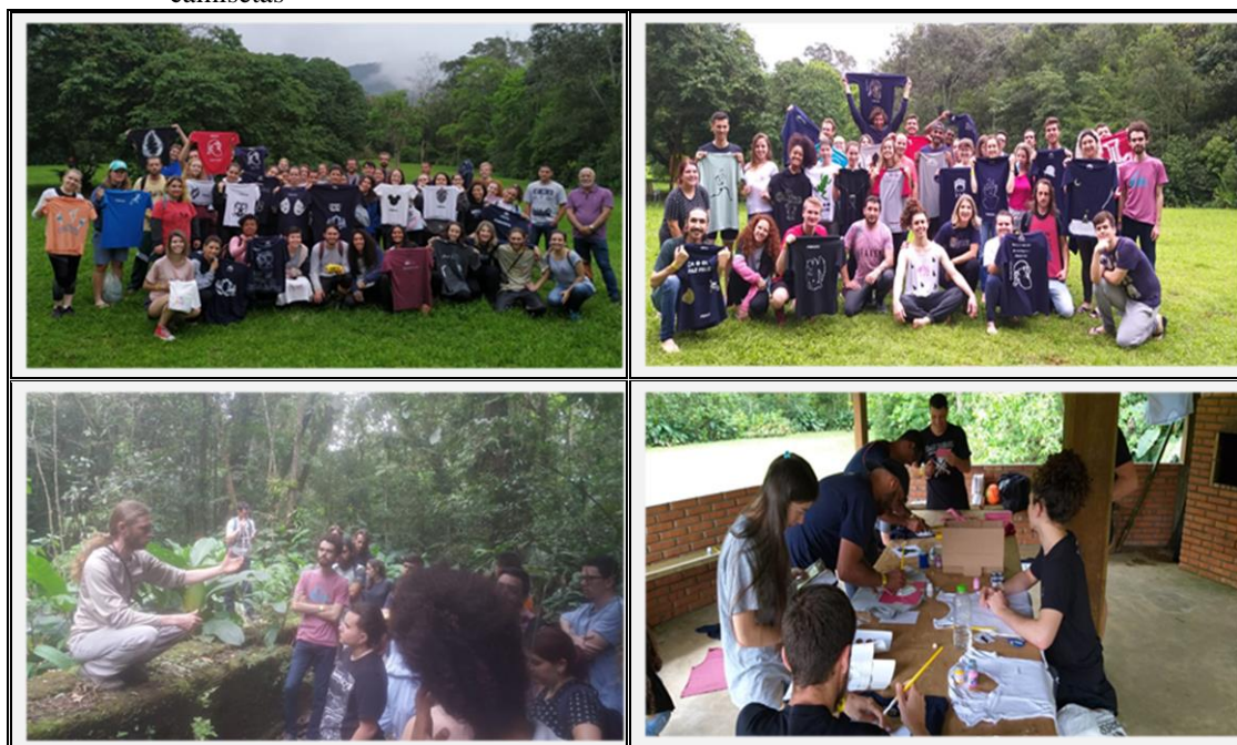
Figura 2 – Educação Ambiental crítica no Parque nas Nascentes – trilhas e customização de camisetas

Nessa atividade, aproveitamos para soltar nossa criatividade e criar a marca para a camiseta que usaríamos no seminário estadual ao final do curso. A técnica usada foi a do Stencil e, como regra básica, concordamos em reutilizar uma camiseta, dialogando assim com o objetivo do desenvolvimento sustentável – ODS 12, que trata do consumo e da produção responsáveis.