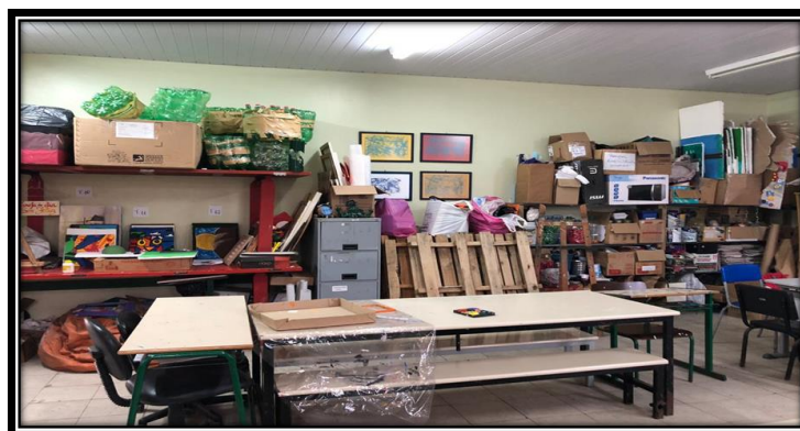
Figura 16 – Sala de Artes

desorganizada, ou seja, uma sala apenas destinada para pinturas e criação de elementos da educação artística. A sala tem uma variedade de materiais, garrafas, tintas, paletes, jornais, livros e dentre outros objetos que estimulem a criação dos alunos. Está sala não é climatizada, mas tem um ventilador de parede, o que auxilia o ensino nos dias com temperaturas altas.