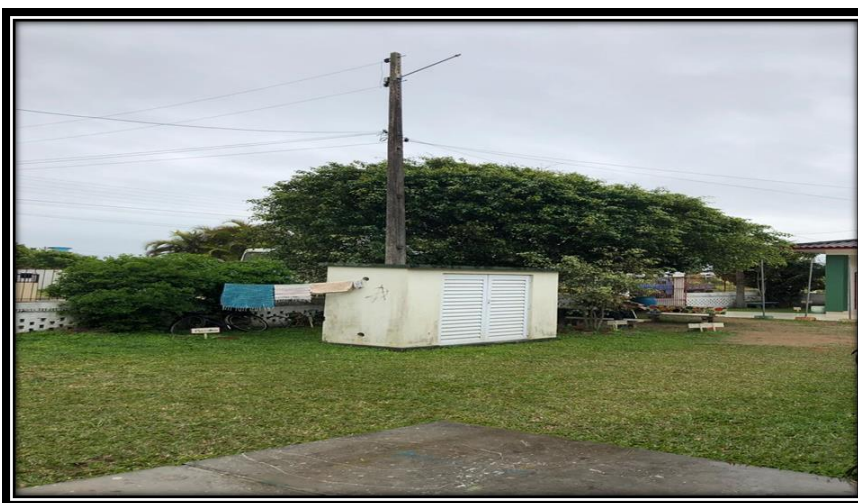
Figura 18 – Central de Gás

É bom elencar que mesmo com todos esses espaços a escola também carece de melhorias, em todos os locais mencionados, desde manutenção de jardinagem, manutenção estrutural e, principalmente pintura em vários locais visitados. Outro aspecto negativo e relevante de mencionar é a posição da central de gás localizada na frente da escola, próximo a entrada principal, e a posição da fossa que também pelo que foi observado fica em uma posição não adequada, trazendo muitas vezes desconforto para as pessoas presentes na escola devido à obstrução ou excesso de rejeitos.