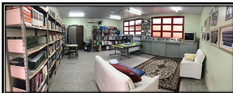
Figura 17 - Biblioteca

Outro espaço analisado da escola foi à biblioteca (figura 8), podemos averiguar que o espaço também consiste em ser adequado e com vários instantes metálicos, dois sofás, um televisor, um ventilador de teto, um ventilador de parede, ar condicionado, iluminação adequada e bem arejada. A ressalva neste espaço durante as observações feitas, diz respeito ao material pedagógico. Faz-se necessário um cuidado melhor com o acervo existe e a compra de livros, com títulos direcionados aos itinerários mencionados, espaço também necessita de uma melhoria em relação aos móveis e mais mesas para os alunos utilizarem caso necessitem fazer pesquisas.