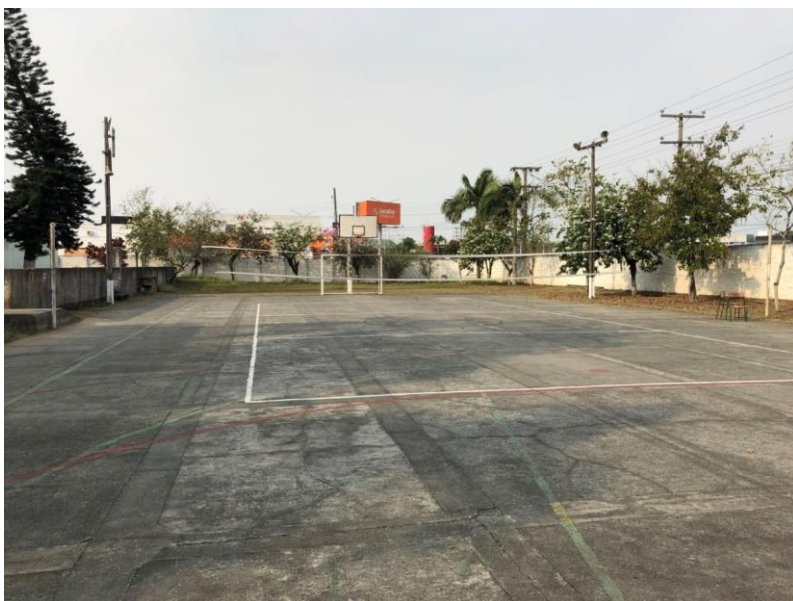
Imagem 8 – Quadra de Esportes