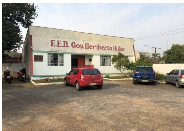
Imagem 1 – Fachada da escola