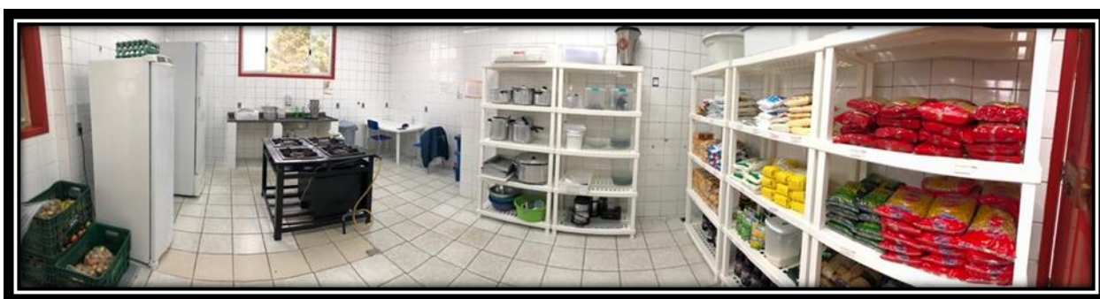
Figura 15 – cozinha

Portanto a sala dos professores com todas as características mencionadas, contempla o espaço para colaboradores que ali frequentam e utilizam para o exercício da profissão. Já o espaço destinado para preparação da alimentação na escola conta com duas cozinhas, uma para os alunos e outra destinada aos professores. A cozinha para os alunos (figura 6) possui: uma geladeira, um freezer, um fogão industrial, armários para guardar alimentos e utensílios, espaço com água corrente para limpeza e lavagem de alimentos dentre outros objetos necessários em uma cozinha.