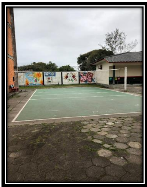
Figura 13: Quadra Externa

A escola também possui uma quadra descoberta (figura 4) construída e sinalizada pelos próprios alunos. Apesar de a quadra não conter as medidas oficiais, ela é um espaço utilizado em várias atividades esportivas e artísticas. Destacamos que todo espaço na escola é explorado de forma criativa e tendo o professor como mediador, possibilita novas práticas pedagógicas e permite aos alunos um nível de reflexão sobre o local onde estão inseridos, com a finalidade de compreender novos significados em relação às atividades.