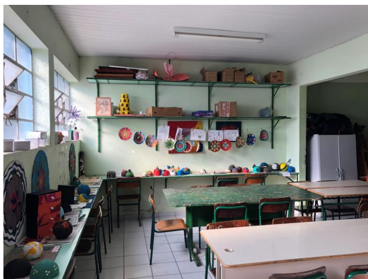
Imagem 6 – Sala de Artes

A sala de artes é bem organizada e conta com vários materiais disponíveis para a produção dos alunos. Porém, hoje esse local é utilizado apenas pelos alunos do Ensino Médio Inovador (EMI), sendo que a utilização desse espaço poderia beneficiar na aprendizagem e produção dos demais alunos da escola e, conseqüentemente, nos novos alunos que irão surgir após a nova organização do currículo do Ensino Médio.