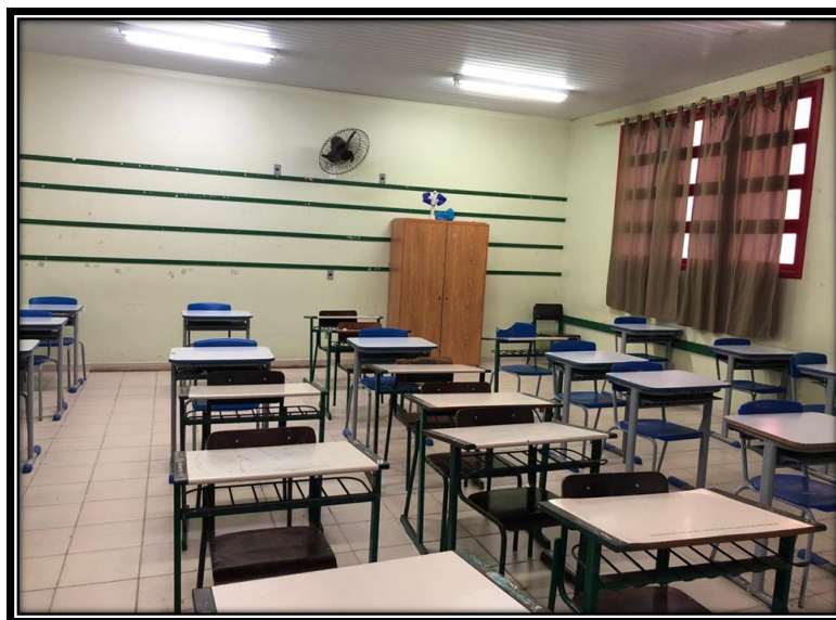
Figura 10 – Sala de aula

Na escola em análise identificamos que a estrutura física é composta por sete salas de aula, sendo todas elas arejadas, com iluminação adequada e as carteiras apropriadas para a acomodação dos estudantes (figura 1). Além disso, destacamos que em apenas três salas existem ar condicionado, as outras salas são compostas por ventiladores de parede. Sendo assim, ressaltamos que em dias com temperatura elevada, se faz necessário que todas as salas estejam adequadas, a fim de proporcionar aos alunos um conforto que os auxilia na aprendizagem.