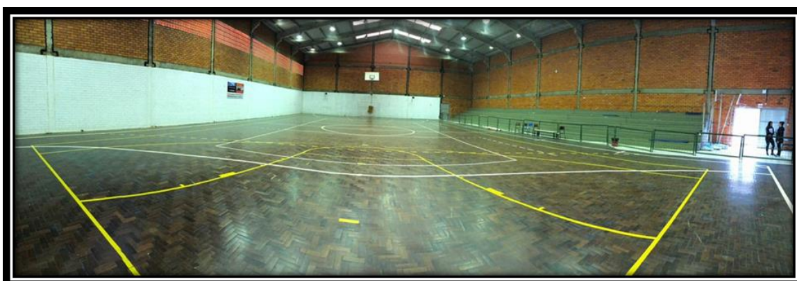
Figura 12 - Ginásio

Outro espaço da estrutura física da escola é o Ginásio (figura 3), o qual está bem iluminado, arejado e composto por vestiários, banheiros, arquibancada e rede de proteção. Porém, o local carece de um cuidado especial na limpeza, pois pelas fotografias capturadas, ficou nítido que falta um espaço adequado para guardar material de Educação Física.