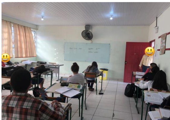
Imagem 2 - Sala de aula