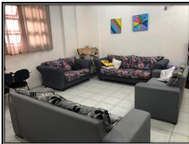
Figura 14 – sala dos professores

A sala dos professores é outro espaço físico da escola que possui boas instalações. Essa sala é ampla e composta por um jogo de sofá, TV, ar condicionado, mesa para refeição, cadeiras, banheiros, internet, entre outros utensílios que promovem conforto para os professores. A sala além de ser um ambiente grande, também é bem arejado e iluminado.