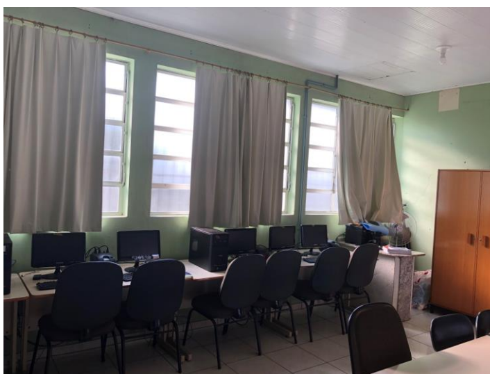
Imagem 4 – Laboratório de informática

questionamos: será que escola não recebe subsídios para fazer a manutenção dessas máquinas? Destacamos também que este espaço está servindo como um depósito de carteiras, que se encontram empilhadas nos cantos da sala. Somando esses fatos, concluímos que o laboratório não está sendo devidamente utilizado pela escola e consideramos o laboratório de informática fundamental para a formação técnica e profissional dos alunos na nova organização curricular.