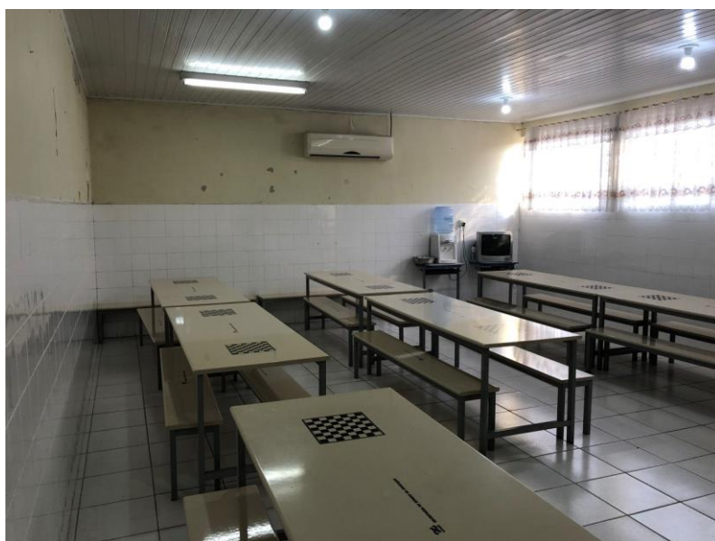
Imagem 8 – Refeitório

Em relação ao refeitório, o espaço é bem organizado, limpo e climatizado. Concluímos, que o espaço se adequa a nova demanda de alunos. Não tivemos acesso à cozinha, mas em conversa com membros da escola, os mesmos relataram que a merenda escolar e cozinha são terceirizadas.