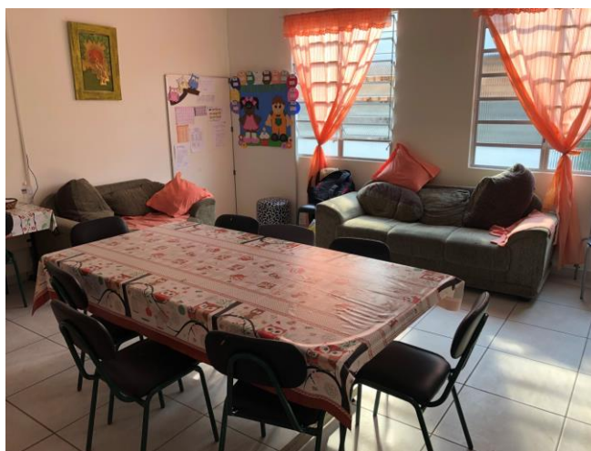
Imagem 9 – Sala dos professores

A sala dos professores possui boas instalações. A sala é ampla e arejada, além de contar com sofá, mesa para refeição, cadeiras, banheiros, internet, e conforto para os professores, causando sensação de tranquilidade para os profissionais que utilizam esse espaço.