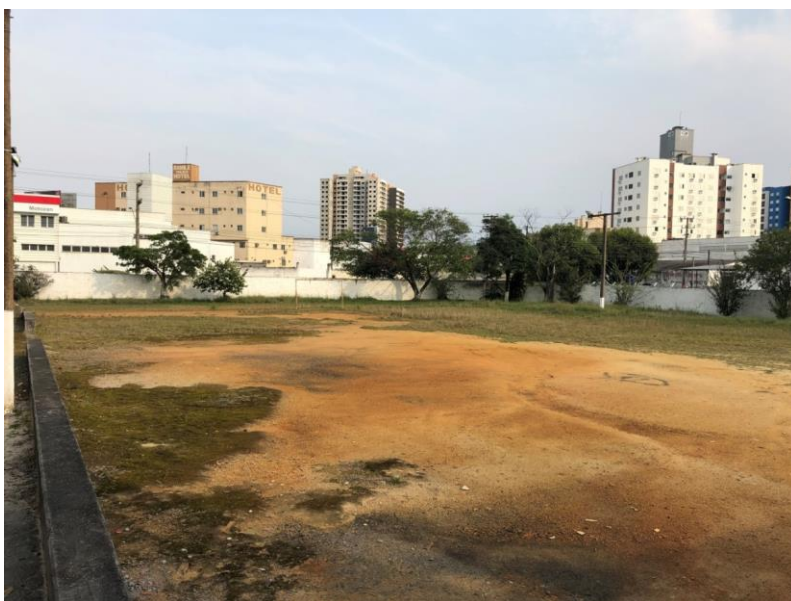
Imagem 7 – Campo de Futebol

O campo de futebol é um espaço bem amplo, porém, poderia ser melhor cuidado, pois grande parte do campo não possui grama, as traves não tem redes, além de não ter linhas de marcação, parecendo assim, ser um espaço abandonado. A quadra poliesportiva é descoberta, o espaço é o mais utilizado nas aulas de Educação Física, porém, o piso da quadra é bem irregular, o que pode ocasionar em algum acidente e colocar a integridade física dos alunos em risco. Outro detalhe importante, em relação à quadra é que a mesma não possui iluminação e esse espaço não é utilizado no período noturno. Com isso, os alunos desse período utilizam o pátio da escola para realizar as atividades de Educação Física. Evidencia-se que esse espaço necessita de reforma e melhorias para atender as demandas formativas na Educação Básica.