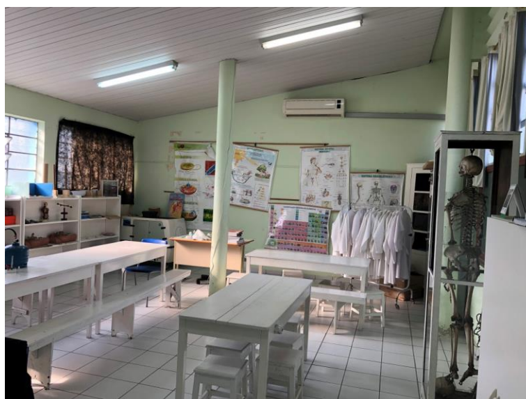
Imagem 3 – Laboratório de Ciências

A escola possui um laboratório de ciências muito bem equipado e organizado. Sendo que, além de possuir uma variedade de materiais para uso dos alunos, o local ainda conta com um profissional para orientar as atividades propostas. Consideramos este um ótimo local, e que se bem explorado, poderá ser de grande importância para os alunos que optarem por esse itinerário formativo, ou formações vinculadas a área.