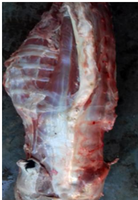
Figura 7 - Reprodução experimental, necropsia bezerro n° 1: Escoliose na coluna torácica.