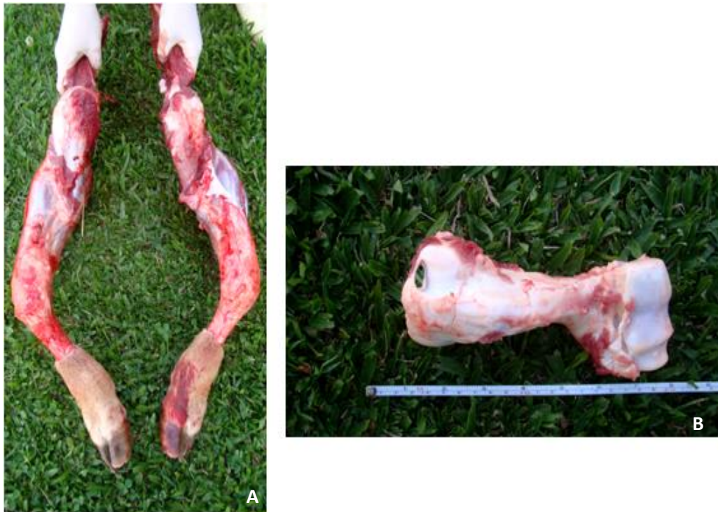
Figura 4 - Intoxicação natural por bagaço de maçã. Necropsia bezerro propriedade 2: A) ossos curvados. B) comprimento e espessura anormais (reduzidos)