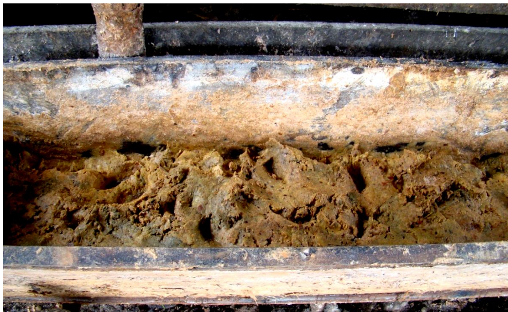
Figura 5 - Bagaço de maçã no cocho