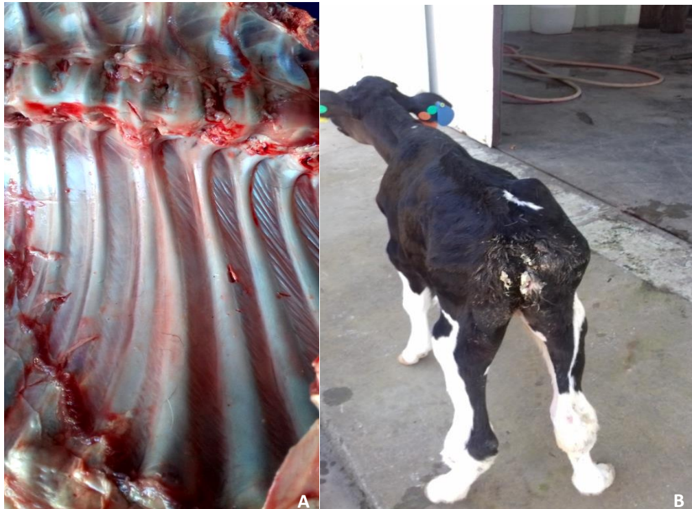
Figura 6 - Reprodução experimental, necropsia bezerra: A) Coluna vertebral com ausência completa das vértebras coccígeas. B) Membros posteriores encurvados e articulações grossas.