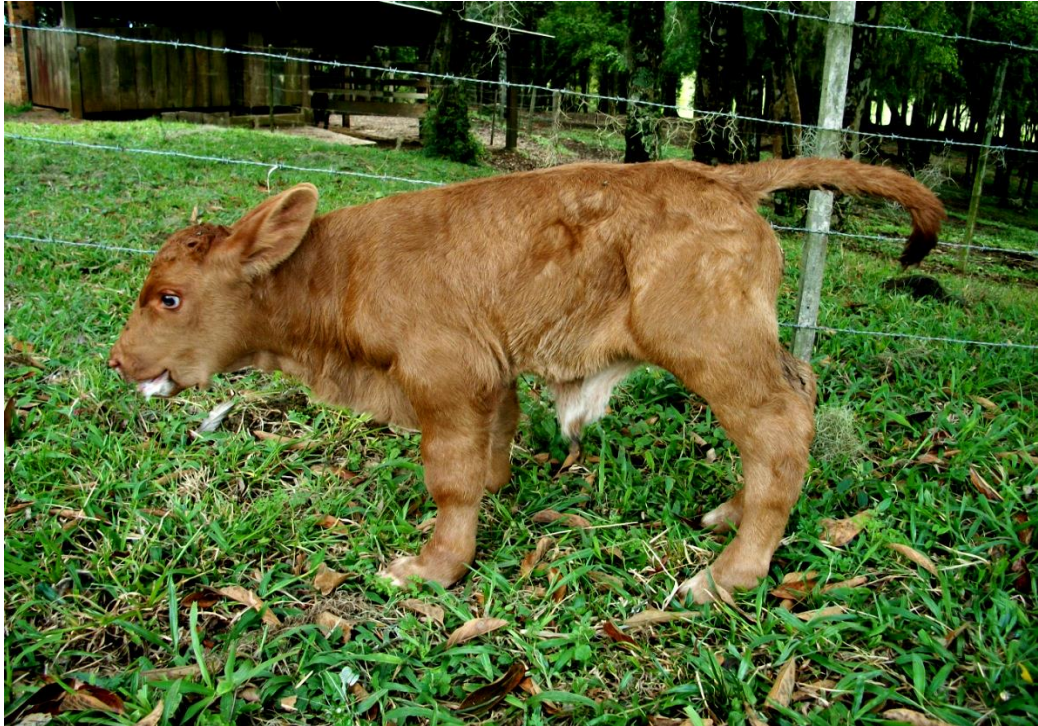
Figura 3 - Intoxicação natural por bagaço de maçã: bezerro com cabeça desproporcional ao corpo e focinho curto. Membros anteriores e posteriores curvos e curtos e articulações grossas.