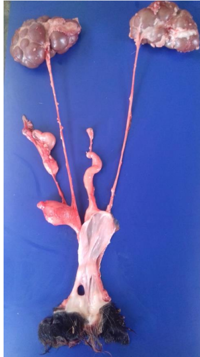
Figura 8 - Reprodução experimental, necropsia bezerro nº 1: aparelho genitourinário. Desvio do ureter direito, estendia do rim ao colo do útero.