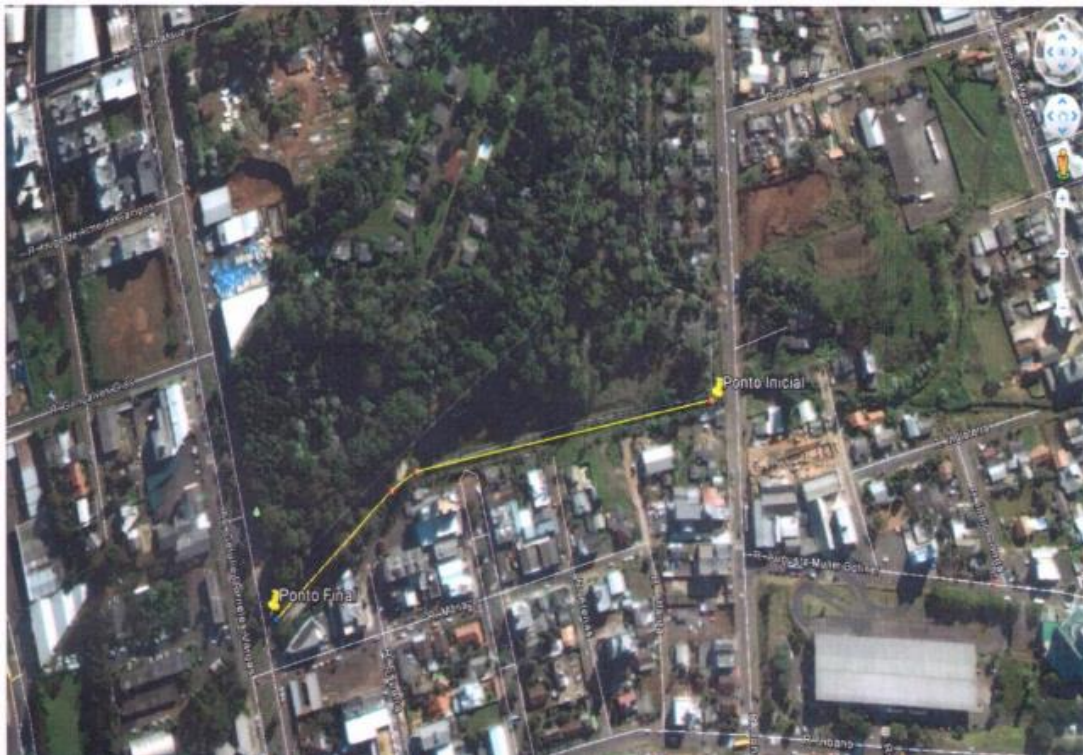
Figura 3. Localização do trecho a ser desassoreado e incluído na licença nº. Drag nº 001/2014.

A questão da abertura do que já existe canalizado em algumas situações, acaba sendo inviável, tanto da parte econômica quanto ecológica. Como há inúmeras construções no caso do calçamento, há uma grande camada asfáltica, também por se tratar de uma área urbana em expansão. Há outras situações, como os trechos que se encontram abaixo de determinadas ruas e, inclusive, casos onde construções inteiras foram executadas sobre os canais fluviais.