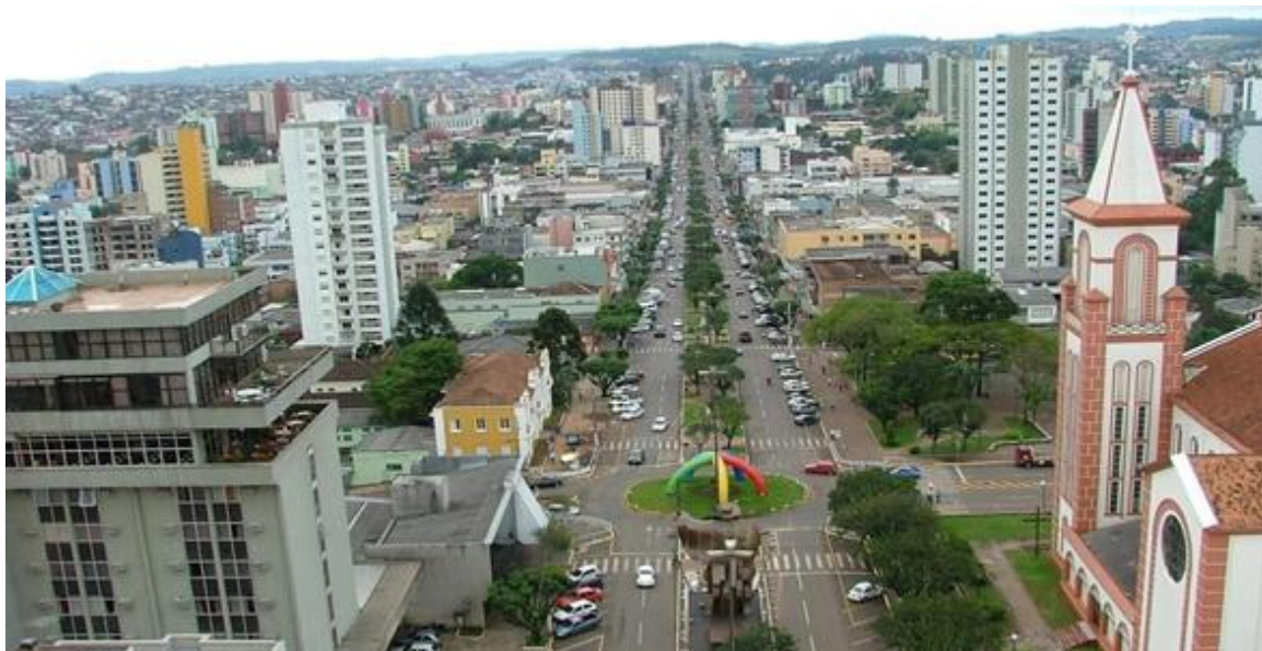
Figura 1. Chapecó-SC, 2015.

A sociedade urbana vem sofrendo modificações significativas quanto à ocupação das cidades, principalmente nas últimas décadas, onde a expansão demográfica desenfreada tem provocado transformações sociais e estruturais no espaço urbano (BIONDI; ZEM, 2014).