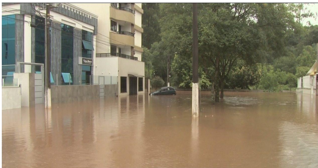
Figura 2. Alagamento ocasionado no dia 15.01.2018 em Chapecó. Trecho do Ecoparque.

O que mais chamou atenção na pesquisa foram a ocorrência de muitas chuvas no mês janeiro de 2018, o que ocasionou enchentes, em vários bairros do município. Na figura 2 um caso de enchente grave que foi no dia 15 de janeiro de 2018, em 45 minutos de muita chuva, já haviam vários pontos alagados, tais como: o rio Passos dos Índios transbordou, fez com que represasse água em parte da rua Mato Grosso. Nos demais locais, a tubulação não conseguiu dar vazão a grande quantidade de chuva, atingindo outras ruas da cidade. Várias casas ficaram alagadas e a água de um riacho subiu cerca de dois metros. As equipes das secretarias de Infraestrutura Urbana foram acionadas e com auxílio de máquinas realizaram a desobstrução de bocas de lobo, tubulações e também a limpeza das ruas atingidas.