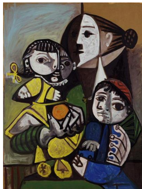
Obra: Mãe com crianças e laranjas Autor: Pablo Picasso Ano: 1951