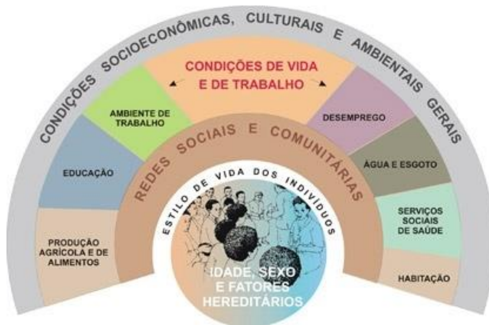
Figura 2 - Determinantes sociais: modelo de Dahlgren e Whitehead, adaptado por Buss, Pellegrini (2007) e Ruschi, Sun, Mattar, Chambô, Zandonade e Lima (2007).

No Brasil, há uma duplicidade de conceitos em relação à APS e à Atenção Básica em Saúde (ABS). A delimitação desta última ocorreu justamente para não se relacionar com uma APS seletiva, voltada para algum foco específico. A decisão de migrar de Programa de Saúde da Família (PSF) para ESF veio para superar a possibilidade de seletividade. Existem vertentes no Brasil que consideram o termo ABS limitado a serviços básicos e que, então, desconsiderariam a grande complexidade que esses serviços demandam. Mesmo com essa discussão conceitual, no Brasil predomina o termo ABS, enquanto que no cenário internacional o termo APS, definido pela Conferência de Alma-Ata, é o mais utilizado (Oliveira e Pereira, 2013).