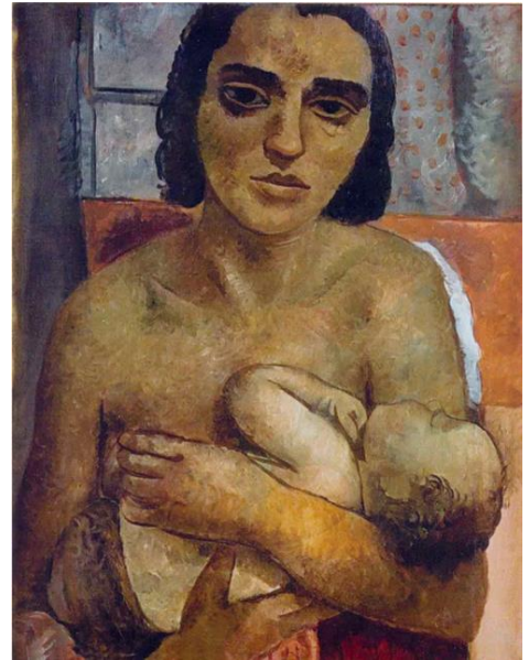
Obra: Maternidade Autor: Lasar Segal Ano: 1936

A partir dos resultados do presente estudo, concluímos que a saúde psíquica da mulher no puerpério não é percebida ao longo do processo de trabalho das eSF. Embora reconheçam que o sofrimento psicológico é multifatorial e está relacionado a aspectos intra e interpessoais, o modelo biomédico é soberano nas práticas dos serviços de saúde no município estudado. No mesmo sentido, quando se trata da saúde das puérperas, os aspectos biológicos são o foco de atenção, pois o que mais é percebido pelos profissionais está relacionado à cicatrização da cesariana, à involução uterina, ao aleitamento materno exclusivo ou predominante, ao estado das mamas para a produção de leite, em síntese, basicamente um olhar às demandas fisiológicas.