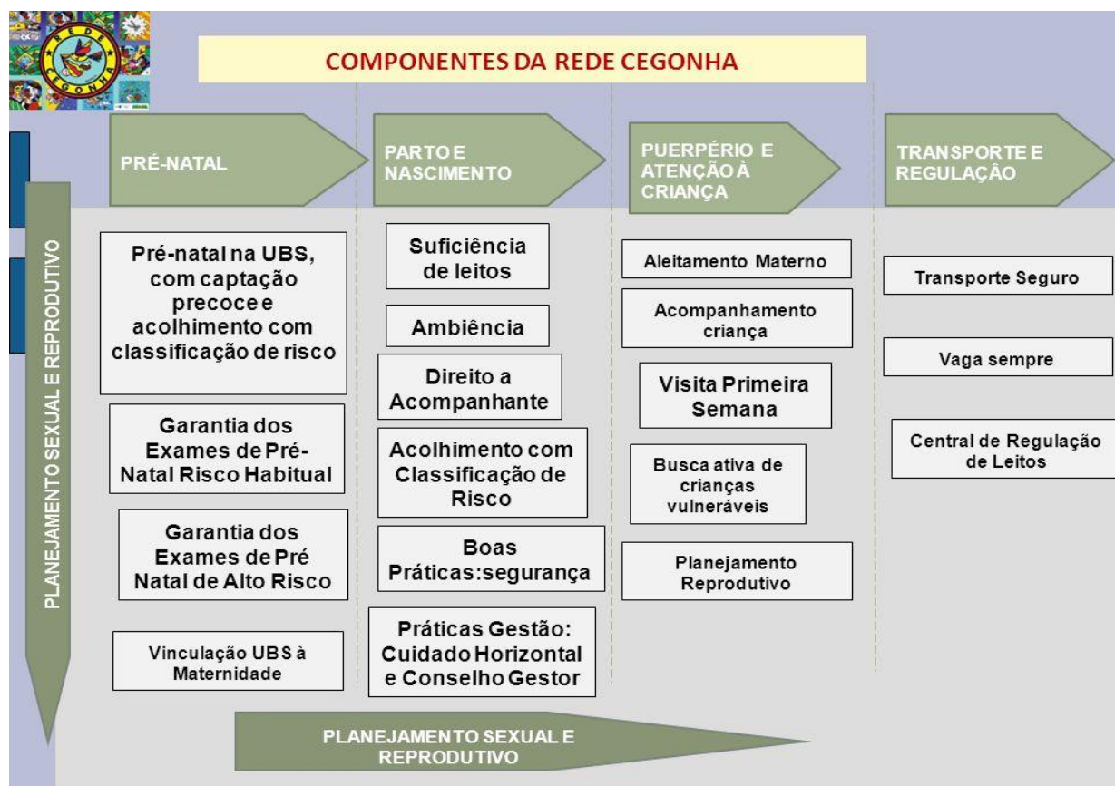
Figura 3: Componente da Rede Cegonha, Brasil (2011b).