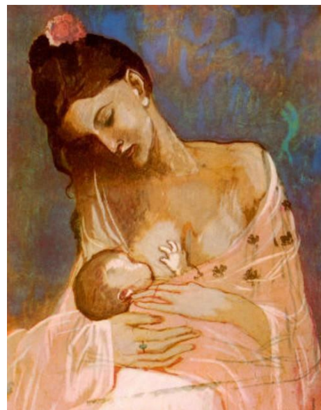
Obra: Maternidade Autor: Pablo Picasso Ano: 1905