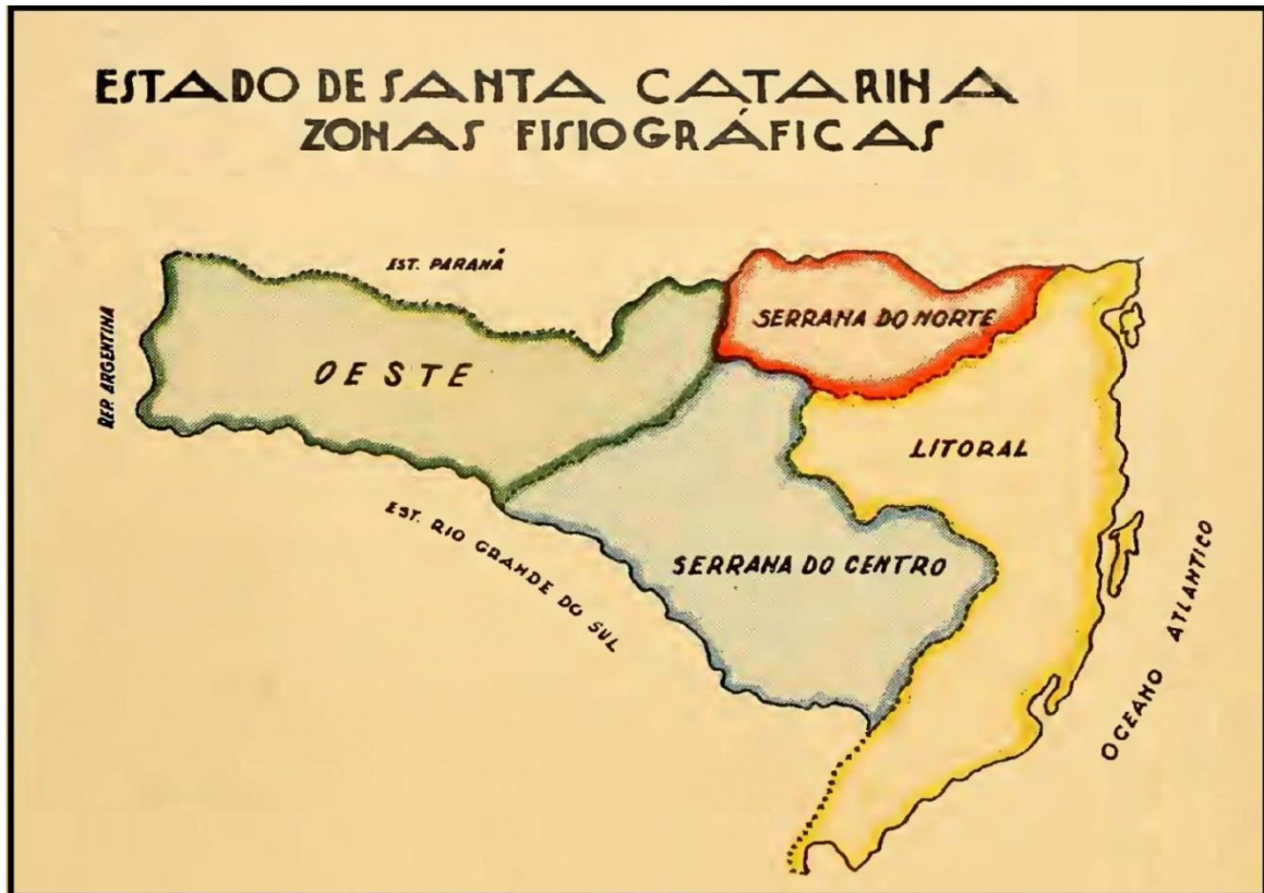
Figura 1 – Regiões do Estado de Santa Catarina, 1938