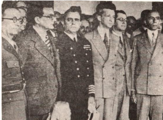
Figura 4 – Posse dos juízes do Tribunal de Segurança Nacional, 1936