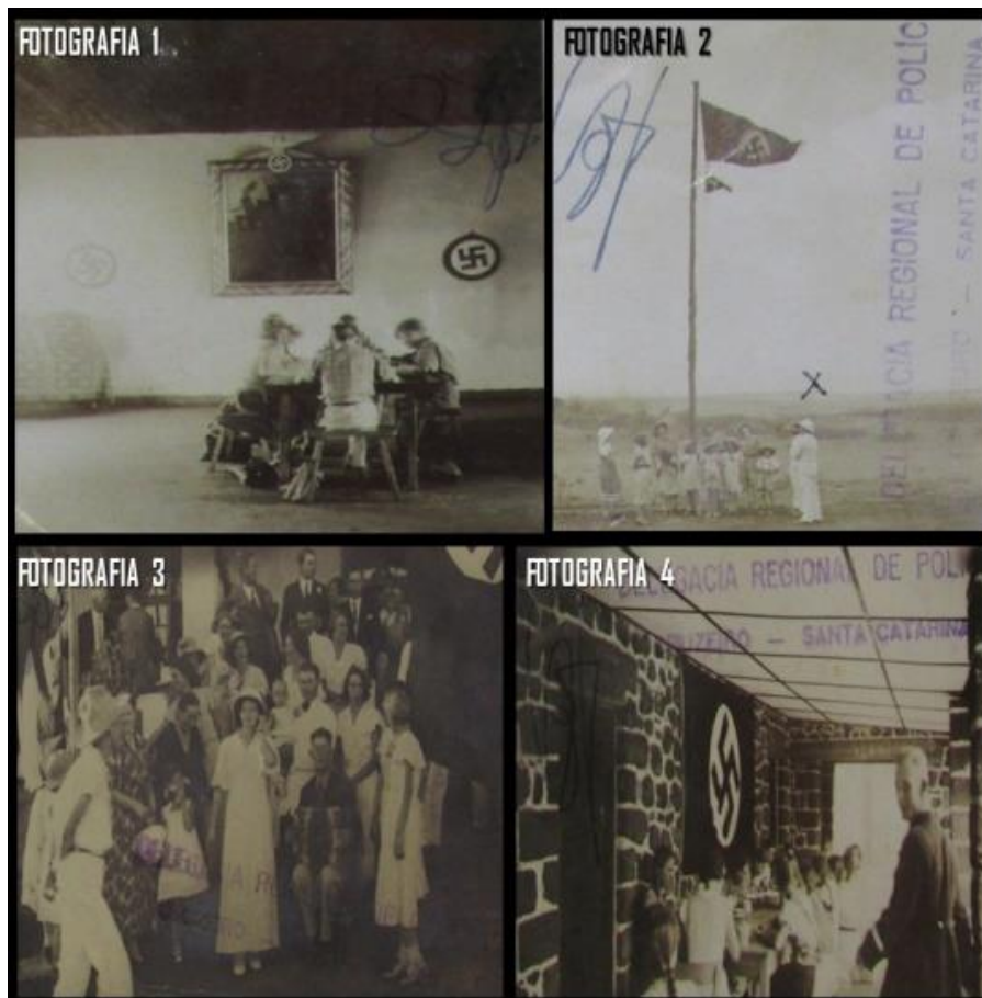
Figura 7 – Fotografias apreendidas na residência do pastor Maskus

As fotografias apreendidas na residência do pastor Herbert Johann Maskus em agosto de 1942 integram o inquérito. O pastor declarou que “representam atividades da escola Deutsche-Schule Oldeam no território de Tanganika, possessão inglesa na África”, explicando que “a fotografia de número 1 é de alunos da escola estudando; a número 2 é de uma festividade esportiva e foi tirada na ocasião em que se procedia ao hasteamento da flâmula da juventude junto à bandeira nazista; a número 3 foi tirada por ocasião da inauguração da escola; a número 4 foi tirada no momento em que os alunos tomavam café na varanda da escola; que o declarante figura na fotografia número 2, juntamente com um dos professores da escola” (P.C. 5.112, 1943, p. 22). Fonte: Processo-crime 5.112, 1943, p. 19-20. Montagem do autor, 2020.