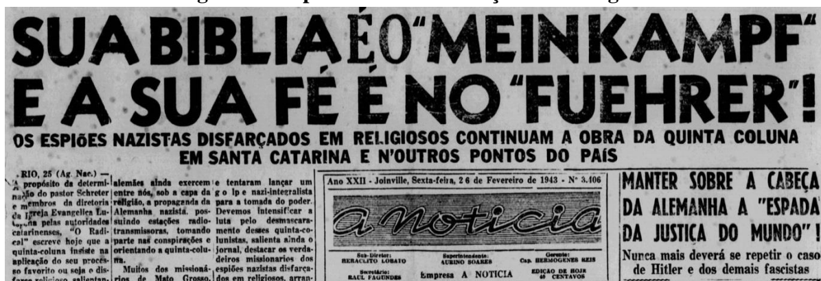
Figura 6 – Espiões nazistas disfarçados de religiosos

Chamada de capa do jornal A Notícia em fevereiro de 1943.