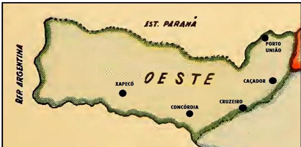
Figura 2 – Regiões Oeste do Estado de Santa Catarina, 1938