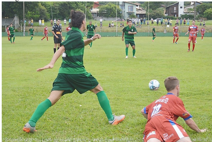
Fotografia 4 – O drible