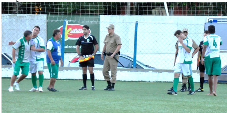
Fotografia 10 – Policiamento acionado

Fonte: Celso Martins/Daqui na Rede 141 .