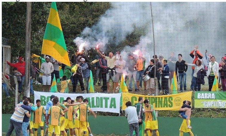
Fotografia 9 – A torcida organizada