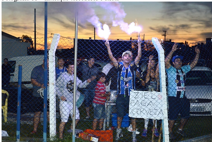
Fotografia 11 – Interação torcedores e atleta