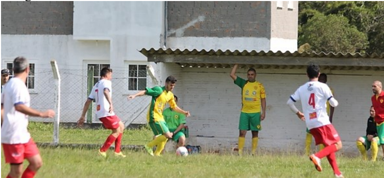
Fotografia 18 – Banco de reservas

Fonte: Michael Gonçalves/Amador Futebol Clube 275 .