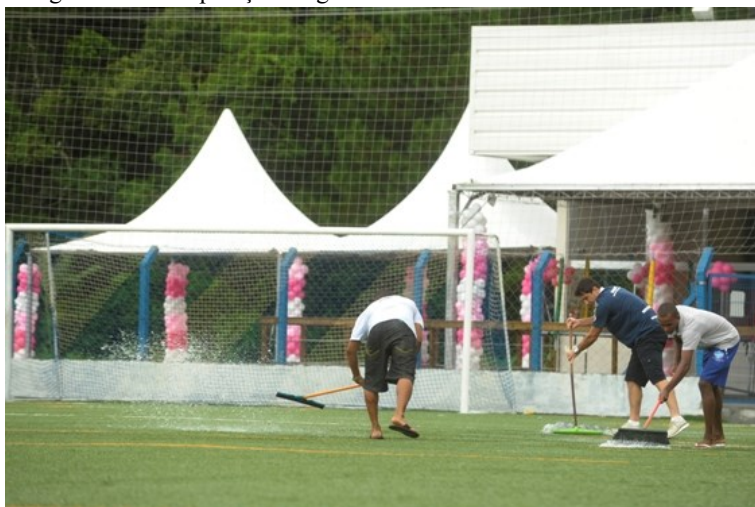
Fotografia 13 – Preparação do gramado