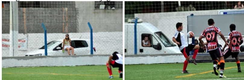
Fotografia 15 – Modos de ver o jogo