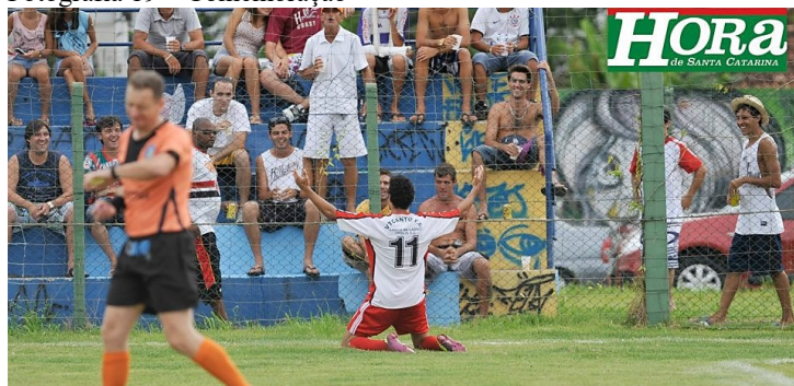
Fotografia 19 – Comemoração

Fonte: Michael Gonçalves/Amador Futebol Clube 297 .