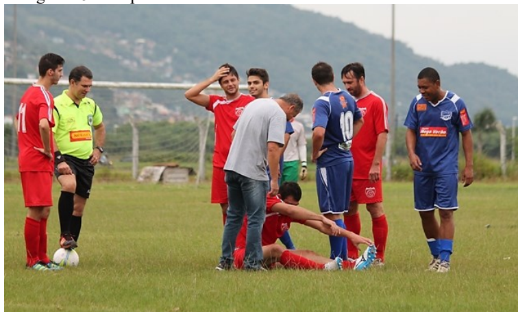
Fotografia 5 – Preparo físico