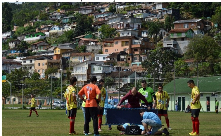
Fotografia 14 – A localização do campo no bairro