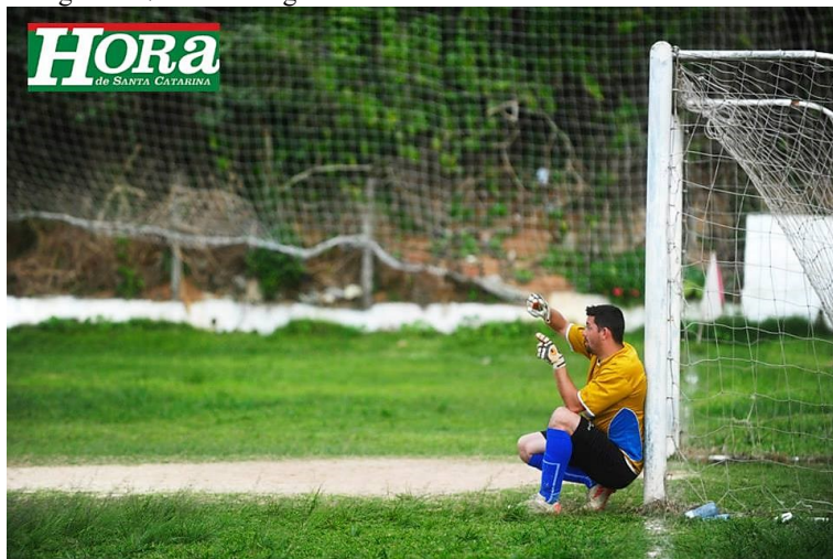
Fotografia 17 – Área do goleiro