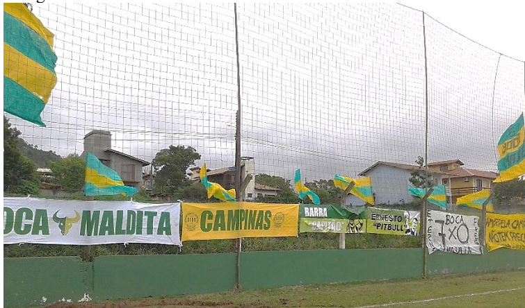
Fotografia 1 – Faixas da torcida local

Dentre as faixas fixadas pela torcida local, além da publicidade dos colaboradores, o tradicional incentivo aos jogadores e outra relembrando um confronto anterior no qual venceu o adversário, uma se destacava ao rememorar o imaginário presente no esporte amador: “Amor pela camisa não tem preço”. Havia ainda uma faixa com os nomes, apelidos e caricaturas de dois atletas: Capitão e Pitbull.