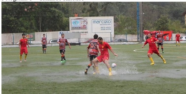
Fotografia 6 – Gramado sintético

Fonte: Michael Gonçalves/Amador Futebol Clube 117 .