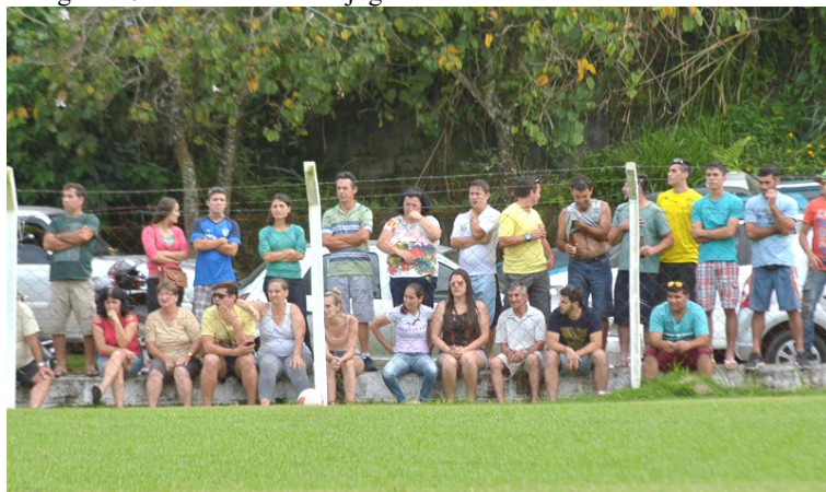
Fotografia 7 – Público fiel em jogo decisivo