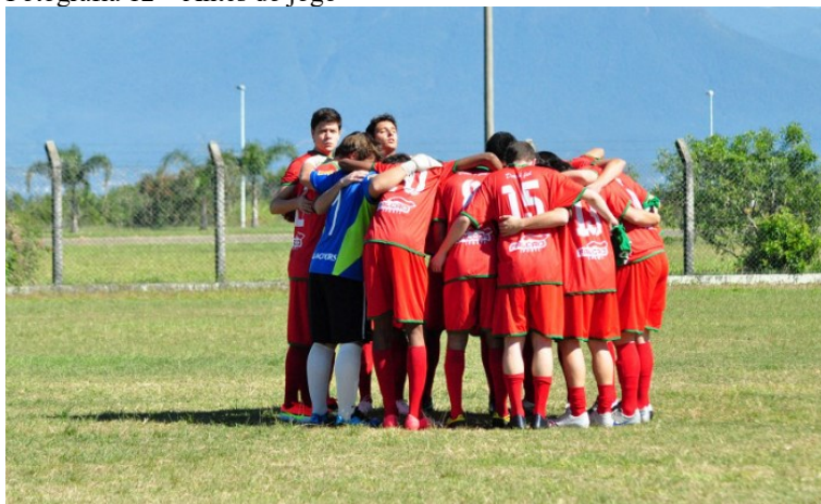
Fotografia 12 – Antes do jogo

Fonte: Celso Martins/Daqui na Rede 154 .