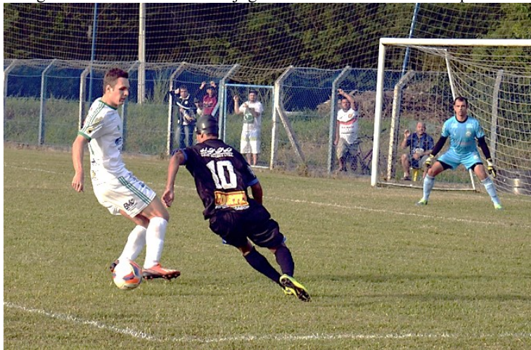
Fotografia 16 – Modos de ver o jogo: o conforto da cadeira “emprestada”