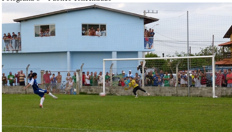
Fotografia 8 – Público concentrado

Nota: Jogo decisivo de um clube que não possui campo próprio e utilizava as instalações de outro localizado no mesmo bairro, o que colaborou para mobilizar maior número de pessoas da comunidade à campo.