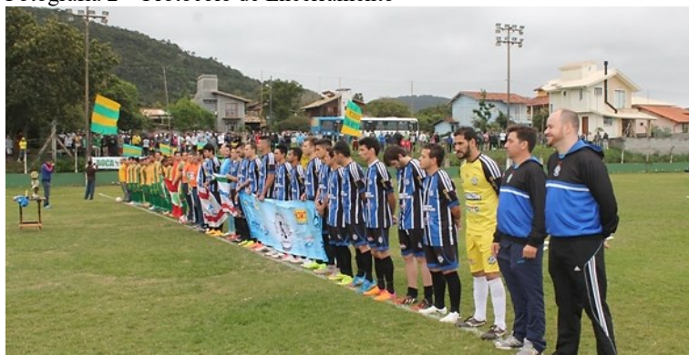
Fotografia 2 – Protocolo de Encerramento