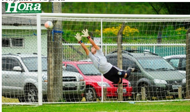
Fotografia 3 – Na gaveta