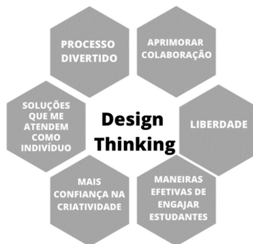
Figura 2: O que o design thinking oferece para Educação

Tendo em vista que nos Serviços de Convivência e Fortalecimento de Vínculos, sejam eles ofertados pelas entidades de Terceiro Setor ou no Centro de Referência da Assistência Social CRAS, são constituídos por equipes multidisciplinares, que possuem profissionais que podem “conversar” entre as áreas, ou seja, compreender os fenômenos e propor intervenções, onde todos os integrantes assumem responsabilidades pelas ações propostas.