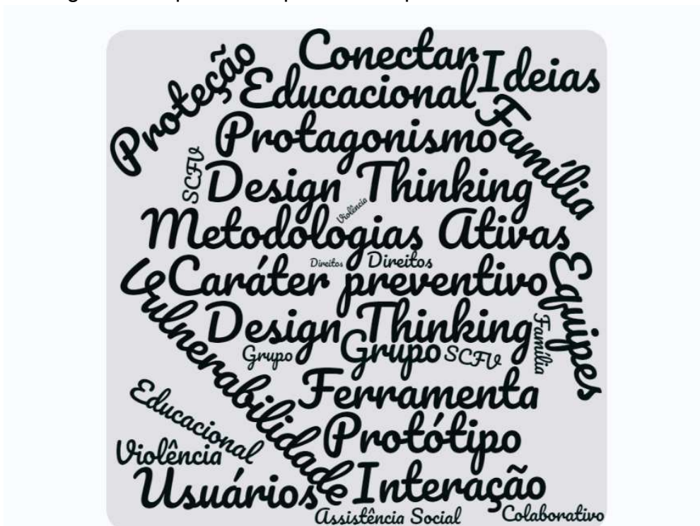
Figura 3: Mapa das frequências de palavras

Para realização da pesquisa foi delimitado um período de tempo de 10 anos (2009 a 2019), tendo em vista que a partir de 2009 a Política de Assistência Social sofre grandes modificações com a implementação da Tipificação dos Serviços Socioassistenciais. Diante a pesquisa realizada segue uma nuvem de palavras que se apresentam mais frequente no texto: