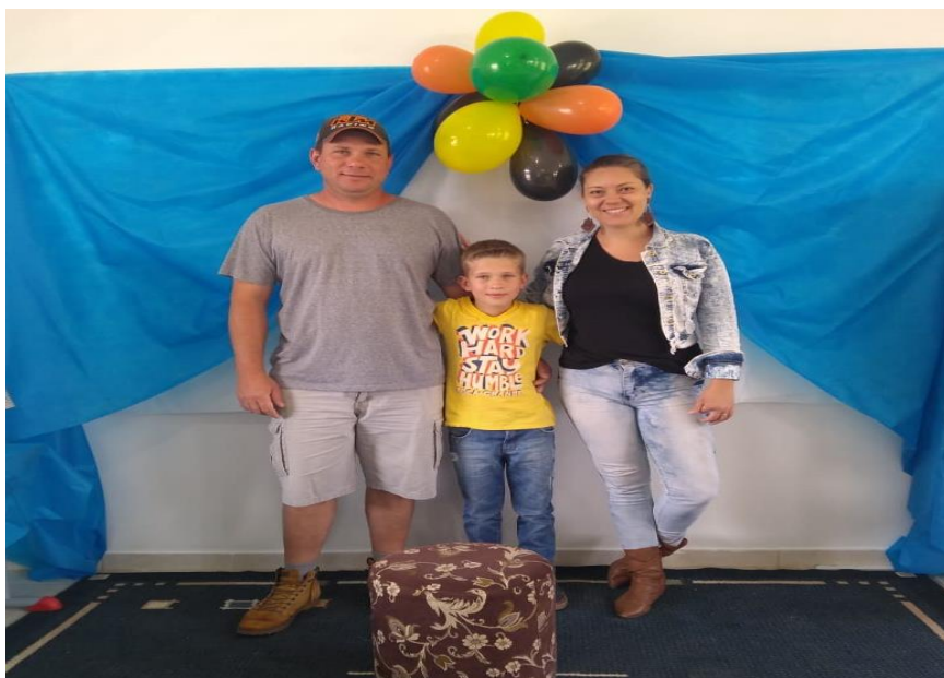
Fotografia 3 – Família de um aluno participando da Feira do JEPP

Com um resultado satisfatório, quase todas as famílias dos alunos do quarto ano participaram, com exceção de apenas duas famílias, as outras participaram ativamente do dia da feira na escola, como por exemplo a família que aparece na Fotografia 3. Muitas mães trouxeram seus filhos menores para brincarem na cama elástica e fazerem pinturas faciais, participaram da sessão de fotos e alguns até fizeram um passeio a cavalo juntos, foi um dia muito produtivo e feliz.