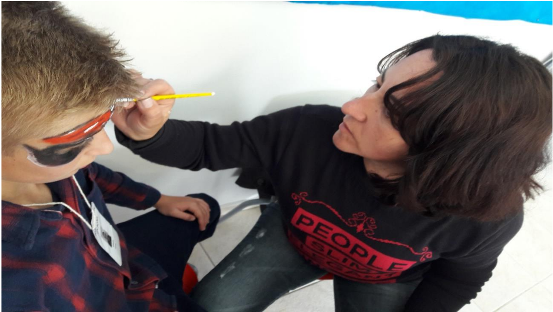
Fotografia 2 – Mãe de um aluno participando do projeto, fazendo pinturas faciais