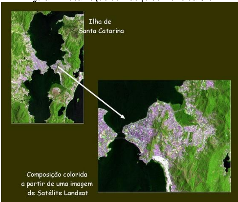
Figura 1 - Localização do Maciço do Morro da Cruz