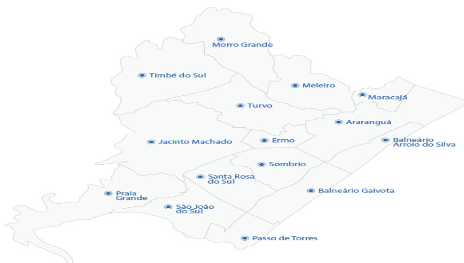
Figura 5 - Mapa dos municípios que compõe a ADR de Araranguá