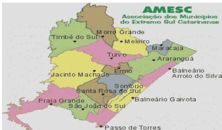
Figura 3 - AMESC – Associação dos Municípios do Extremo Sul Catarinense

Fonte: www.amesc.com.br/index/municipios-associados/codMapaItem/42454