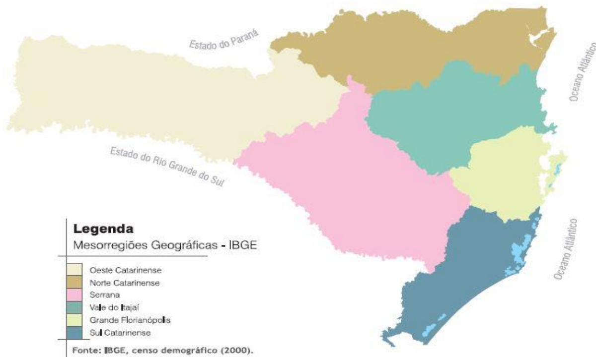
Figura 1 – Mapa das Mesorregiões Catarinenses