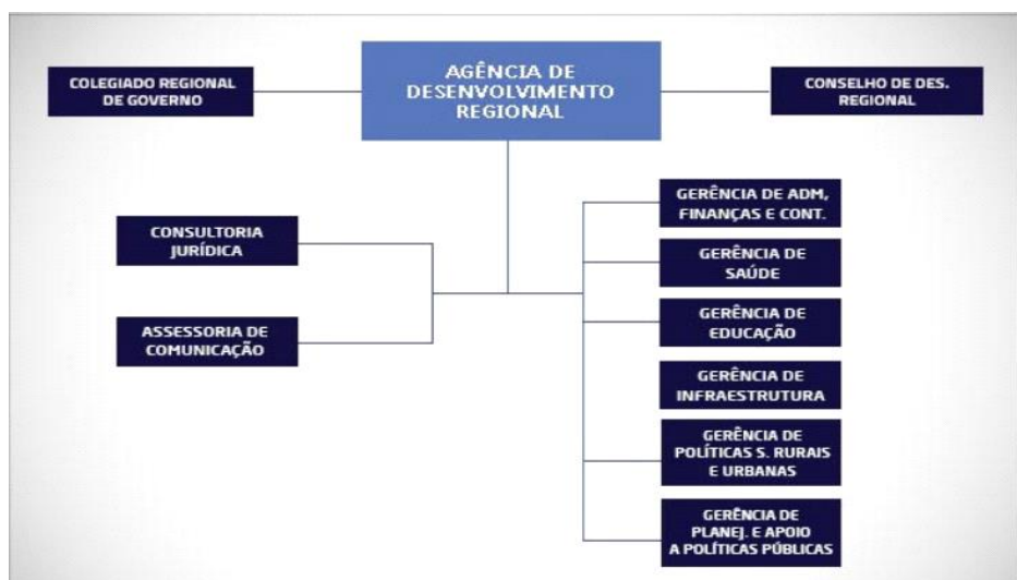
Figura 4 - Organograma das Agências de Desenvolvimentos Regionais – ADRs