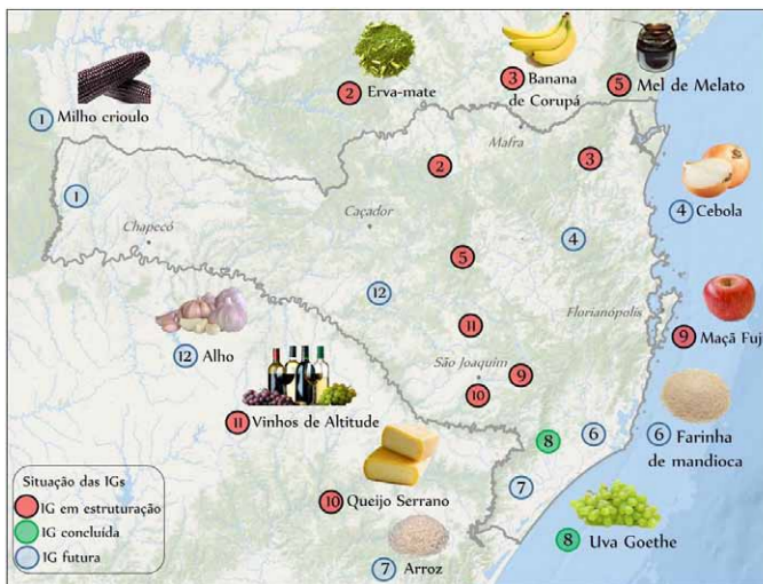
Figura 02– Produtos com potencial de IG

No entanto, mesmo com todos estes desafios, atores importantes como a Epagri tem se destacado nas discussões de IG, principalmente relacionadas a doze produtos, entre eles a cebola, como destacado na figura a seguir: