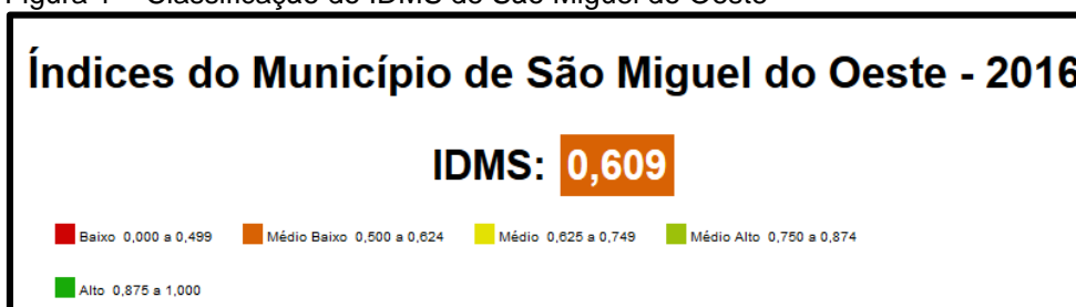
Figura 1 – Classificação do IDMS de São Miguel do Oeste

O IDMS de São Miguel do Oeste, em 2016, foi de 0,609; índice considerado médio baixo nos parâmetros adotados pelo SIDEMS, vide figura 1.