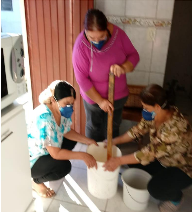
Imagem 7 – Grupo de Produção de Sabão