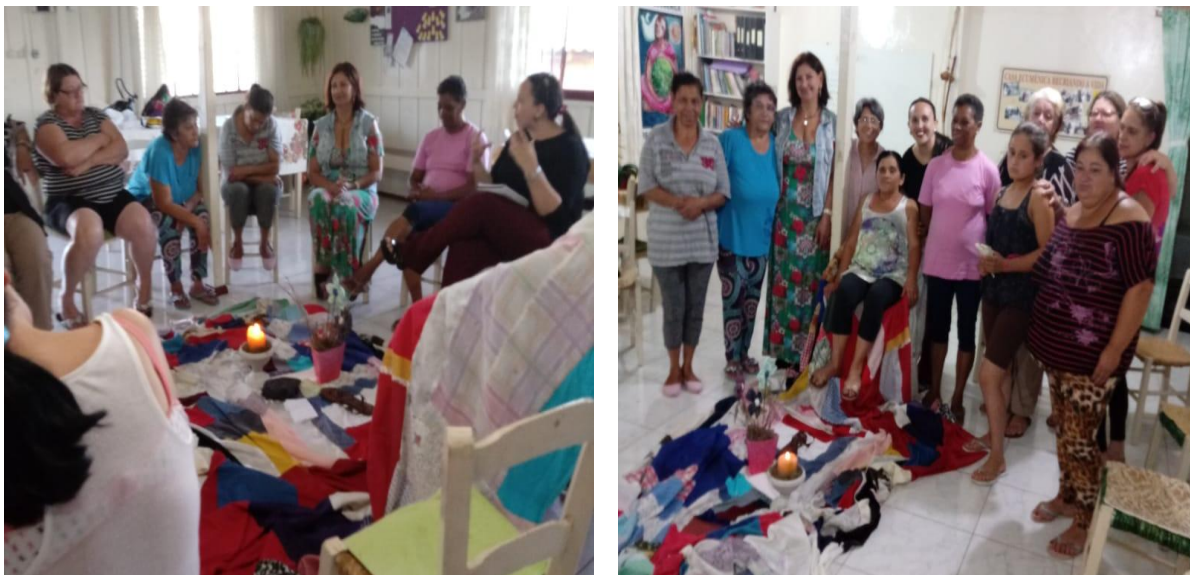
Imagem 14 e 15 – Tenda do Conto

A escolha pela Tenda do Conto se deu devido às características peculiares dessa prática que envolve entrega afetiva, acolhimento, sensibilidade, partilha e a possibilidade de uma vivência que promove a troca de sentimentos e experiências de vida.