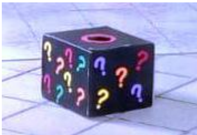
Imagem 12 – Caixa dos Segredos

Com o objetivo de conhecer mais profundamente as participantes foi utilizada a dinâmica da caixa dos segredos que consiste num recipiente que contém em seu interior diferentes tipos de frases a serem completadas com opiniões e sentimentos referentes a diversas situações que vivenciamos no cotidiano e na construção de quem somos.