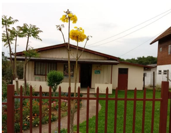
Imagem 1 e 2 – Casa Ecumênica Recriando a Vida

Desta forma foi criada em 26 de fevereiro de 2013 a Associação Serviço Ecumênico Recriando a Vida articulada em rede, o Centro Ecumênico de Estudos Bíblicos da região de Lages (CEBI-LAGES), a Comissão Pastoral da Terra da região de Lages (CPT-LAGES) e a Casa Ecumênica Recriando a Vida (LIVRO ATA, 2013).