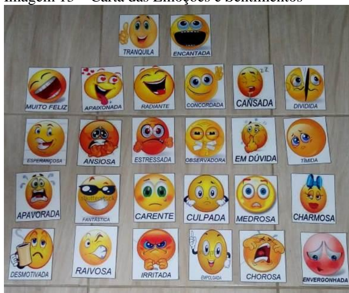
Imagem 13 – Carta das Emoções e Sentimentos

Na segunda roda de conversa foi proposto conversarmos sobre alguns sentimentos e emoções que nos acompanham no cotidiano. A pergunta disparadora do diálogo foi: Como tenho me sentido/percebido nos últimos dias? De forma aleatória, cada participante era motivada a escolher uma ou mais cartas que caracterizasse a sua resposta, iniciando assim a discussão e reflexão sobre a carta escolhida e as situações vivenciadas no dia-a-dia, destacando principalmente a partilha de diferentes estratégias de enfrentamento para cada situação.