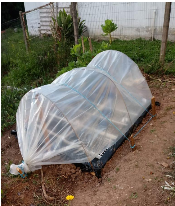
Imagem 8 e 9 – Horta Agroecológica