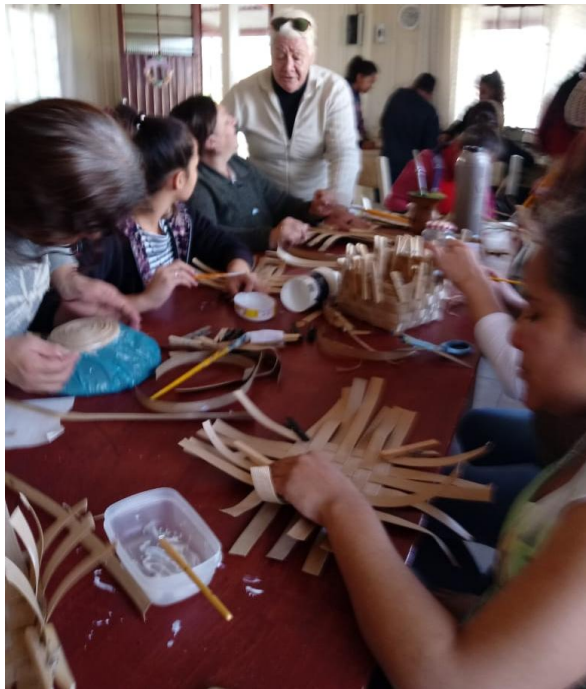
Imagem 5 e 6 – Grupo de Artesanato