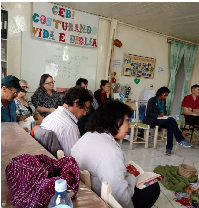
Imagem 11 – Grupo de Estudos Bíblicos da região de Lages (CEBI)