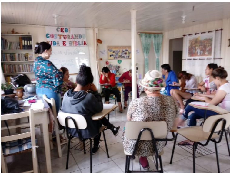
Imagem 19 – Dinâmica do Repolho