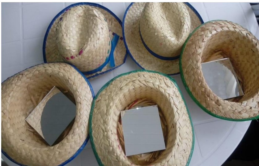
Imagem 17 – Tirando o Chapéu

Com o objetivo de conversar sobre empoderamento e autoestima, foi proposto nesta roda a dinâmica “ tirando o chapéu ”, onde cada participante era convidada a sair do seu lugar na roda e ir até uma mesa que continha em torno de 12 (doze) chapéus, todos com um espelho colado em seu interior, porém, as mesmas não tinham conhecimento desta informação. Ao escolherem um chapéu deveriam olhar para a imagem em seu interior e retornar a roda iniciando o relato afirmativo ou negativo quanto ao tirar o chapéu para a pessoa visualizada, sem revelar a identidade da mesma ao grande grupo.