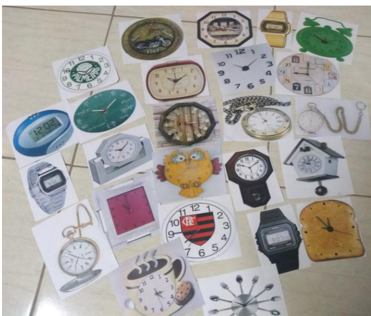
Imagem 18 – Relógios