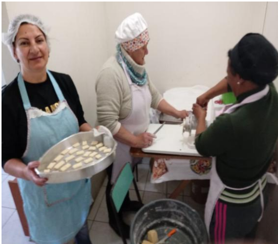
Imagem 3 e 4 – Grupo de Produção de Pão/Bolacha