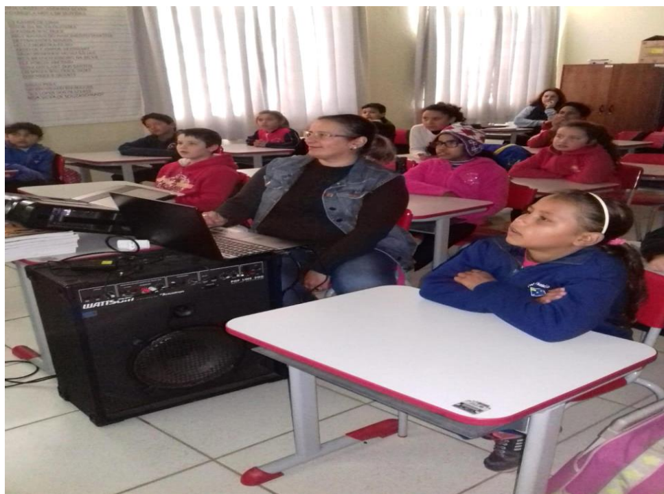
Imagem 2. Os escolares atenciosamente assistindo o Curta “Homem”.