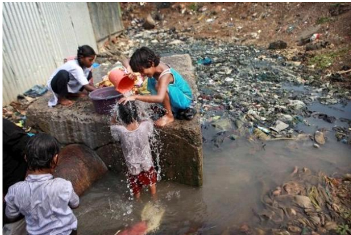
Imagem 1. Crianças brincando no esgoto.

Esta ação teve o propósito de contribuir para que no futuro não vejamos situação como esta onde crianças brincam ao lado de esgoto a céu aberto. É importante refletir sobre a imagem abaixo. Seria essa a imagem que queremos para nossas crianças?