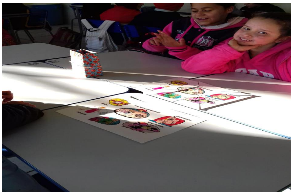
Imagem 4. Quebra cabeça.

No dia 11/07 quarto e último encontro: Tivemos brincadeiras educativas (quebra-cabeça) relacionadas a saneamento básico e saúde. No final tivemos a devolutiva sobre o tema saneamento, o que estes aprenderam durante os encontros? Foi satisfatório esperamos que eles levem para a vida um novo modo de viver, de aprendizado e multipliquem as informações obtidas através desta pesquisadora para pais, familiares e amigos.