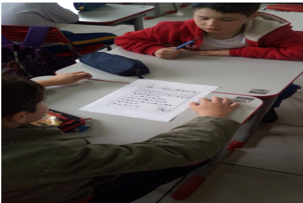
Imagem 5. Cruzadinha: dia do Meio ambiente.