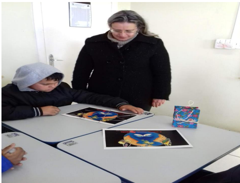
Imagem 7. Quebra cabeça: Salve o Planeta.