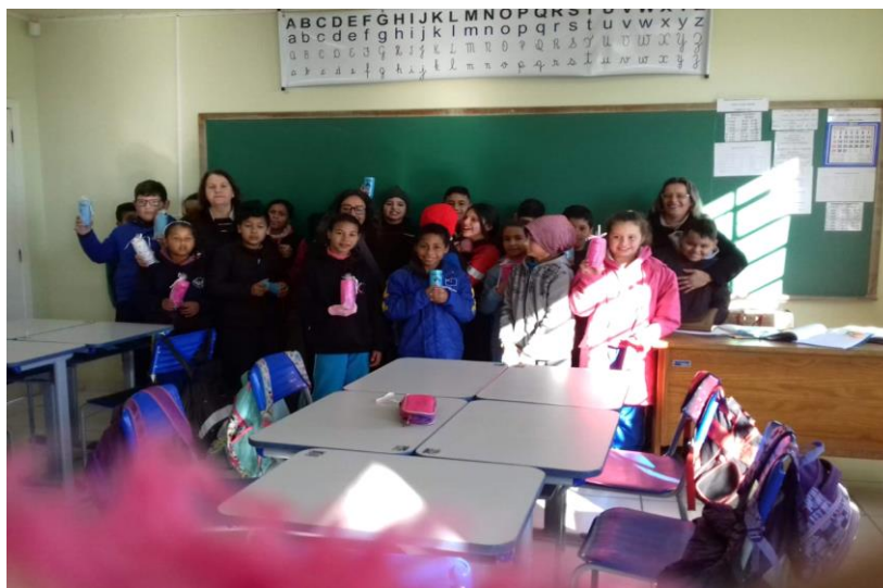
Imagem 8. Encerramento com escolares.