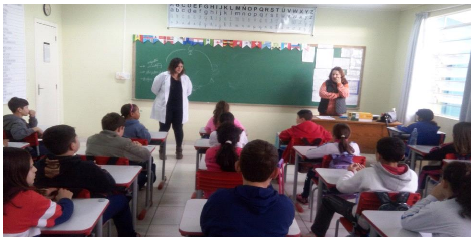
Imagem3. Palestra sobre doenças causadas pela falta de Saneamento.

têm conhecimento da importância de se preservar o Meio Ambiente que precisamos acondicionar corretamente o lixo produzido em casa.