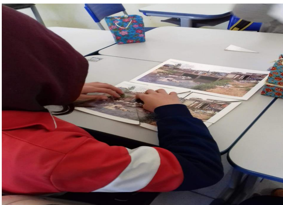
Imagem 6. Quebra cabeça com imagem do rio carahá