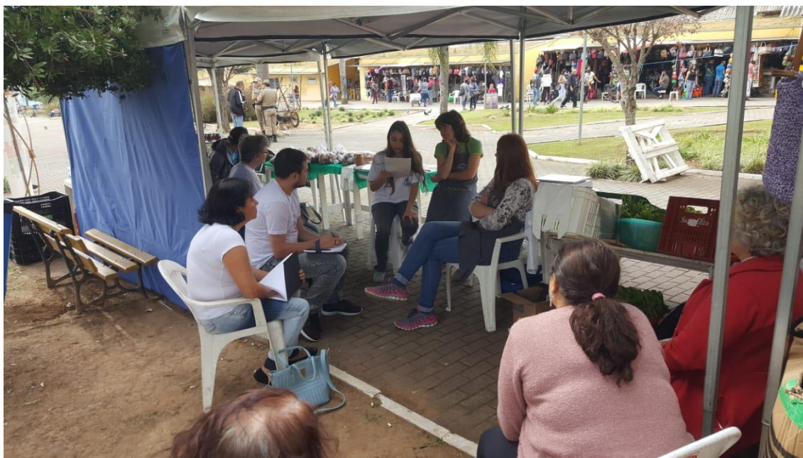
Figura 4 – Último encontro na Feira