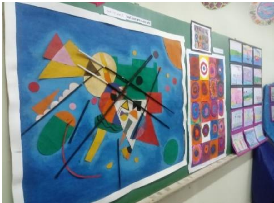
Figura 9- Com jornal enrolado e sobras de papel Kraft. Ampliação da obra Pintura Azul de Wassily Kandinsky.