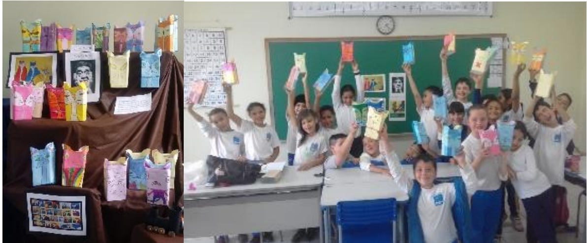
Figura 8- Com caixa de leite vazia foi criado Porta lápis, inspirado na obra “O gato”, por Joan Miró.

De acordo com a ordem da lista observada, segue abaixo os respectivos trabalhos feitos pelos alunos utilizando estes materiais.