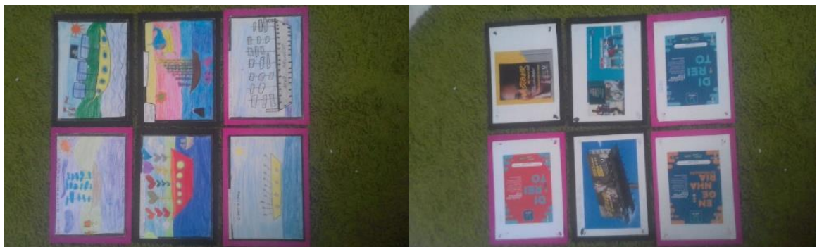
Figura 18- Frente e verso de releituras do “Barco com Borboletas” de Salvador Dalí feitos com folhas A4 reutilizáveis.