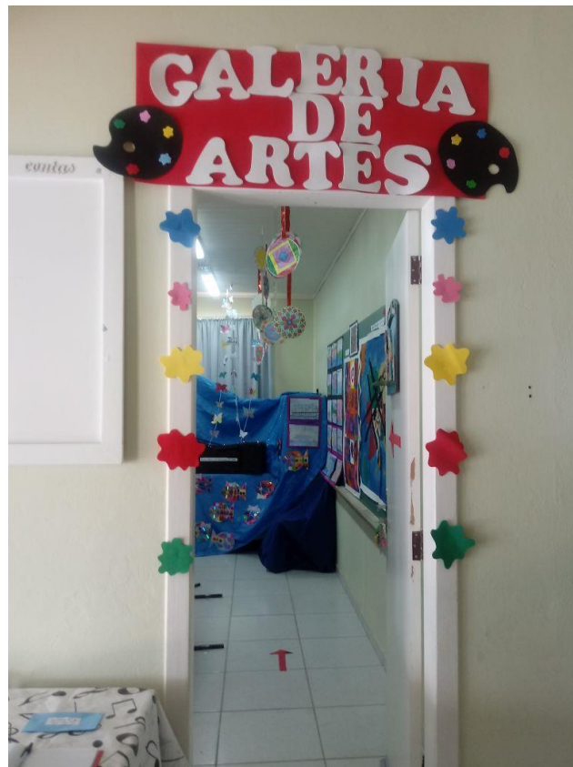
Figura 6- Porta de entrada da exposição dos trabalhos em formato de Galeria de Artes.