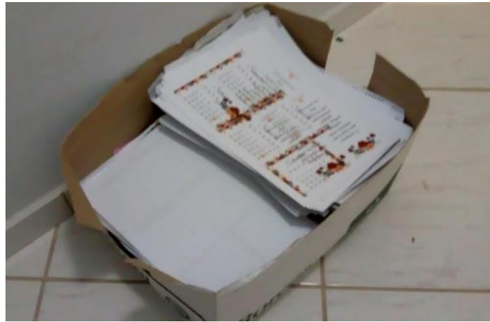
Figura 16- Folhas A4 doada por uma empresa de xeróx, foram reutilizadas em várias atividades artísticas.