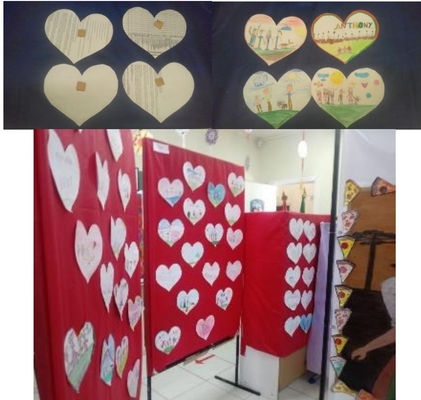
Figura 19- Atividades feita com folhas reutilizáveis para o evento família na escola.