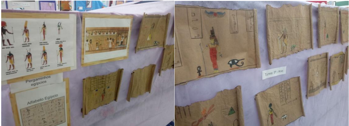
Figura 5- Simulação de pergaminhos egípcios com sobras de papel kraft.

Ao tratar do conteúdo sobre a arte egípcia foi reutilizado sobras de papel kraft que haviam sido utilizadas anteriormente para forrar mesas em um evento da escola e seriam descartadas, foi desenvolvida uma aula diferenciada para reutilizar o papel, os alunos puderam sentir na prática como era realizada a arte nos pergaminhos egípcios, conheceram toda a simbologia por traz de cada traço.