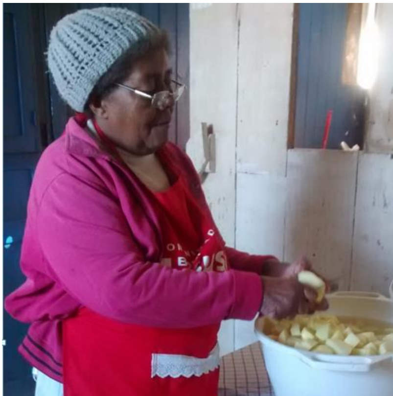
Figura 2: Descascando os alimentos.