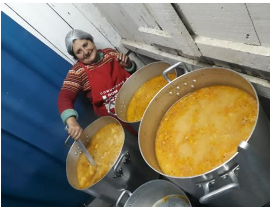
Figura 4: Terminando o sopão para servir