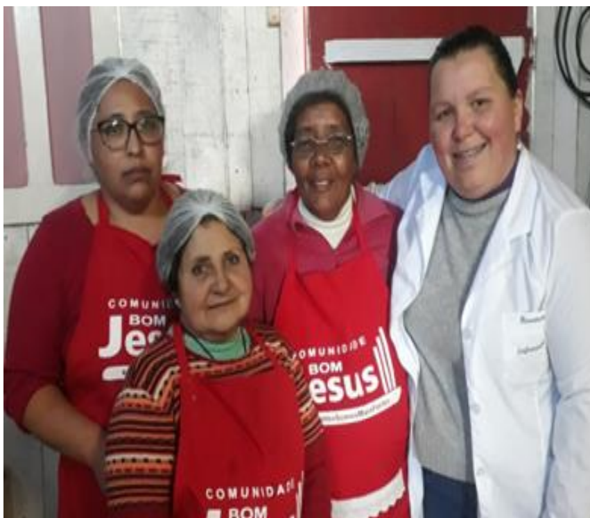
Figura 6: Equipe de trabalho