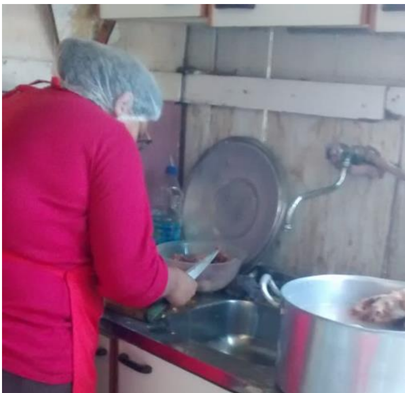
Figura 3: Cortando a carne .