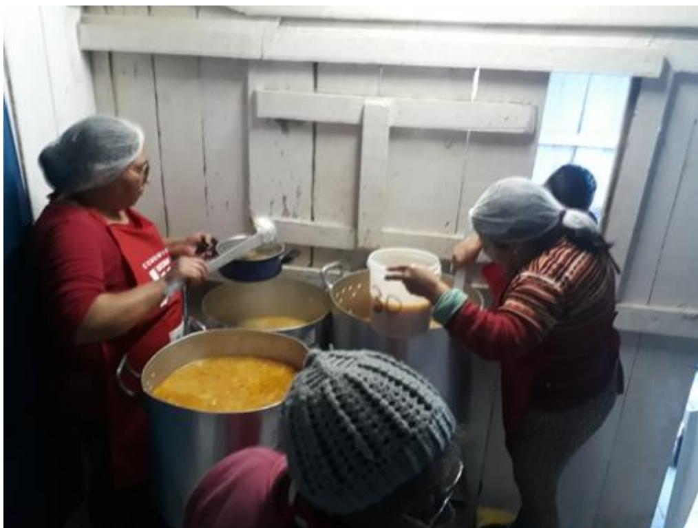
Figura 5: Servindo o Sopão.