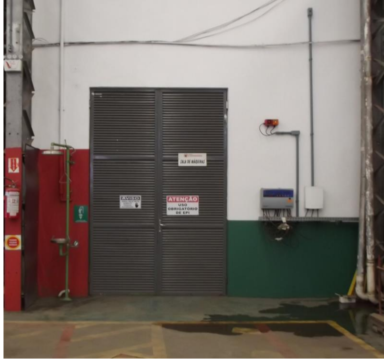
Figura 2 - Entrada da casa de máquina

O descrito acima representa o que chamamos de casa de máquinas (Figura 2 e Figura 3), este local é de suma importância e vital para o funcionamento do sistema de refrigeração.