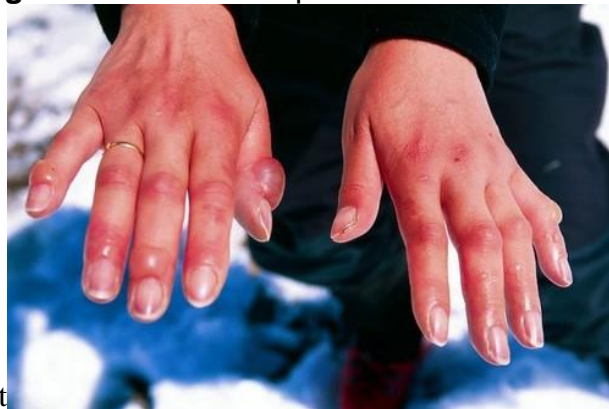
Figura 10 - Ilustrando problema Eritema Pérnio

Eritema são lesões eritematosas ou arroxeadas (Figura 10) atingindo extremidades dos membros que, na fase inicial desaparecem e, em estado avançado, pode ocorrer queimação e prurido local, aparecimento de bolhas, lesões na face e nádegas.