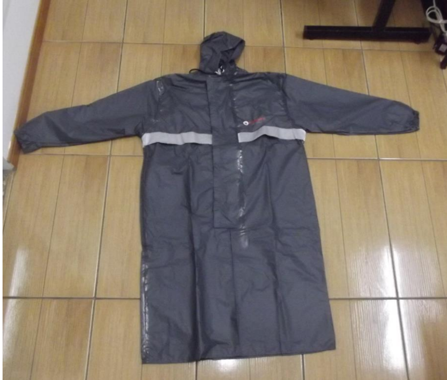
Figura 23 - Avental impermeável