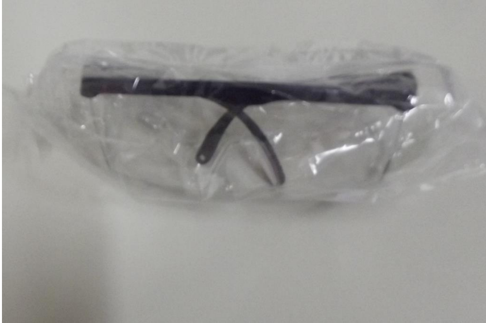
Figura 21 - Óculos de proteção