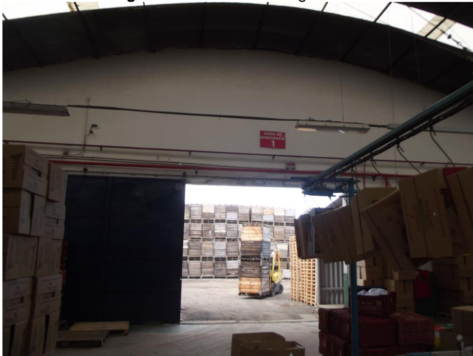
Figura 30 - Saída de emergência 01