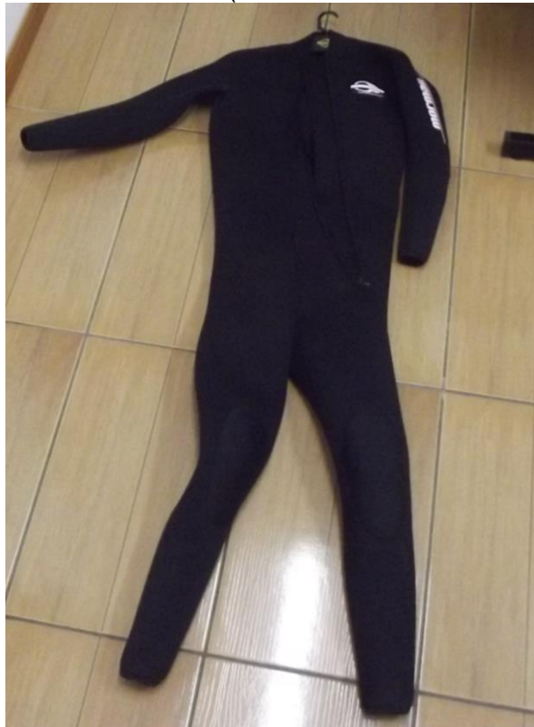
Figura 26 - Macacão térmico ( em caso de vazamento de amônia )