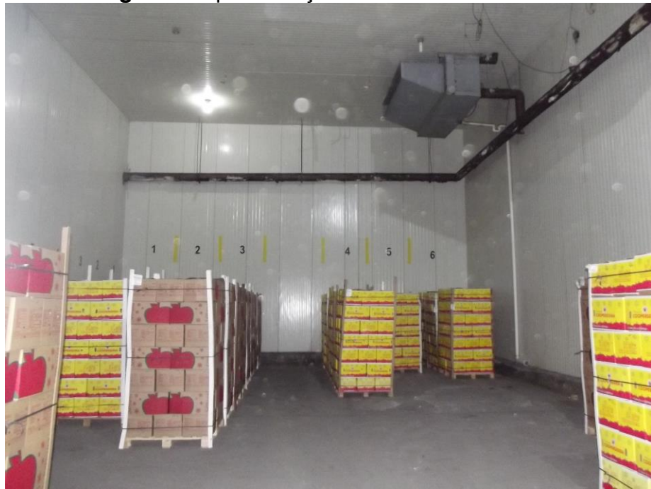
Figura 7 -Apresentação da câmara fria