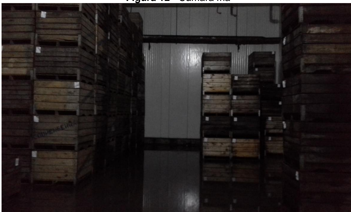
Figura 12 - Câmara fria

A exposição (Figura 12) do trabalhador à umidade pode acarretar doença ao aparelho respiratório, quedas, doenças de pele, doenças circulatórias entre outras.