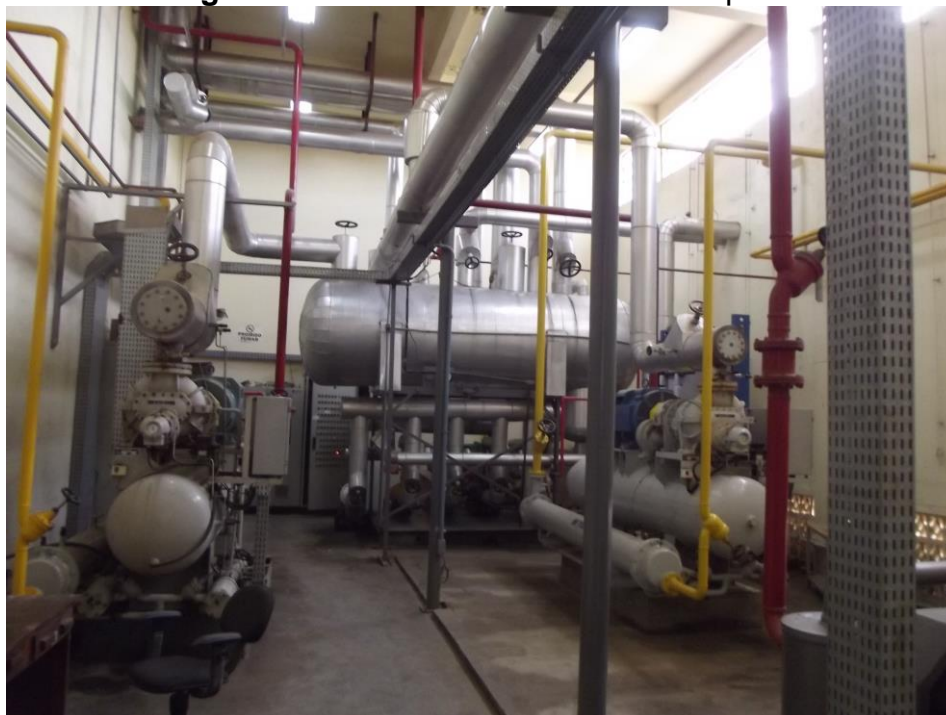
Figura 3 - Panorâmica da casa de máquina