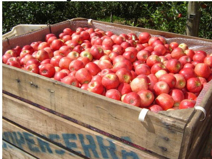
Figura 6- Cultivar Gala

Os frutos são muito atrativos, apresentando cor vermelha e fundo amarelo, lisa é de tamanho pequeno a médio (Figura 6), e sua conservação em câmara fria também se iguala com a cultivar Fuji (Tabela 3). (BONETTI, RIBEIRO, KATSURAYAMA, 2006).