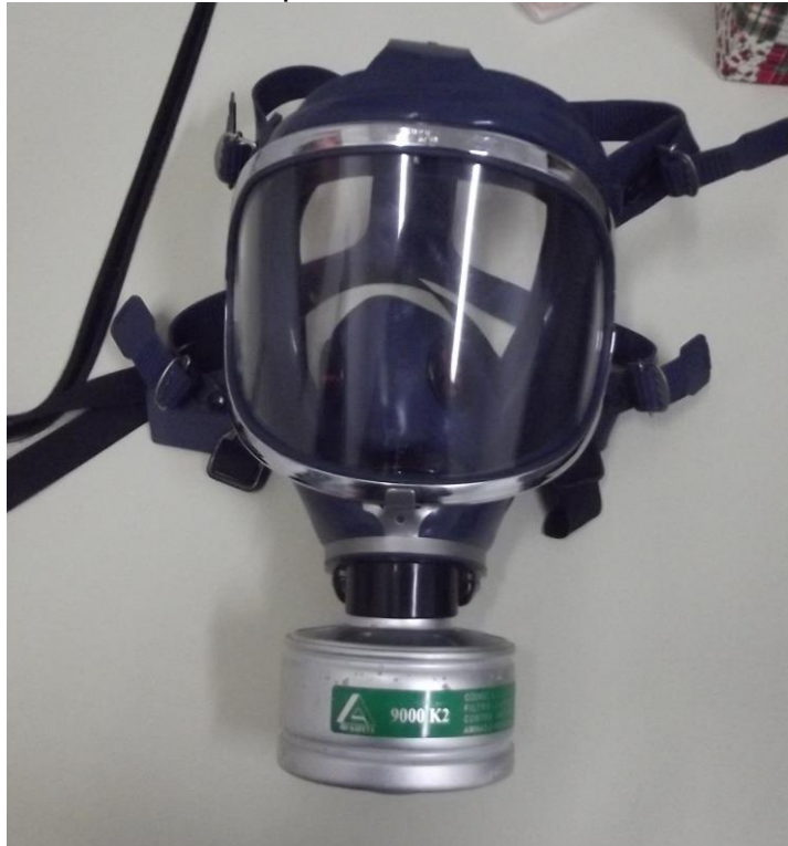
Figura 22 – Máscara para casos de vazamento de amônia