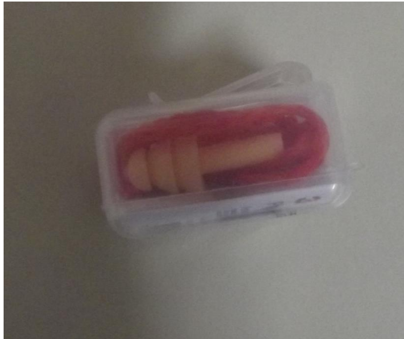
Figura 19 - Protetor auricular tipo plug