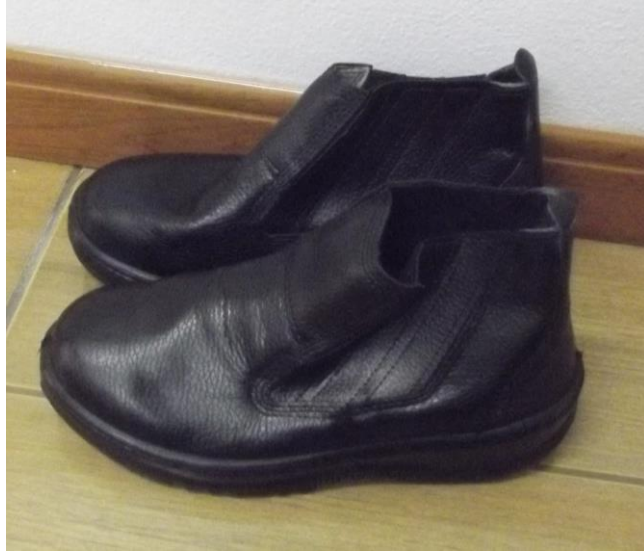
Figura 27 - Botas de segurança