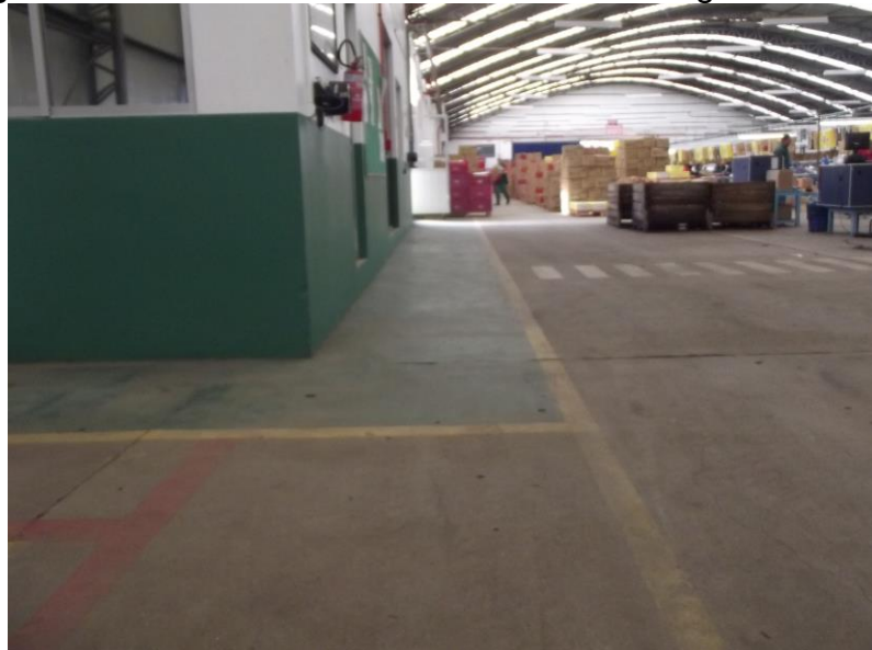
Figura 15 - Pisos demarcados em todo o Paking House