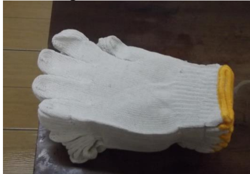
Figura 17 - Luvas Lã

Além disso, os operadores de empilhadeira têm obrigatoriedade do uso de protetor auditivo, preferencialmente tipo concha.