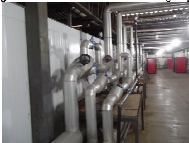
Figura 14 -Válvulas de controle de refrigeração