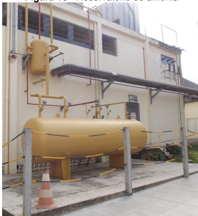
Figura 13 - Reservatório de amônia