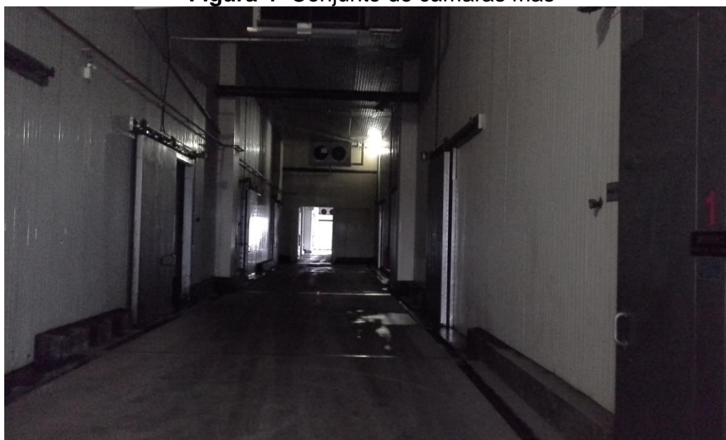
Figura 4- Conjunto de câmaras frias

O objeto de estudo, é uma câmara fria que utiliza a amônia, implantada em 2002, e possui capacidade para armazenamento de 250 toneladas de maçãs anuais. Esta câmara faz parte de conjunto composto de 12 câmaras de dimensões semelhantes. (Figura 4).