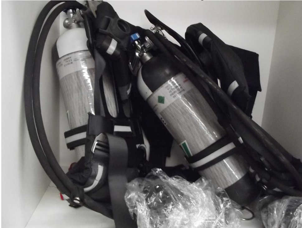
Figura 29 - Cilindro de Oxigênio