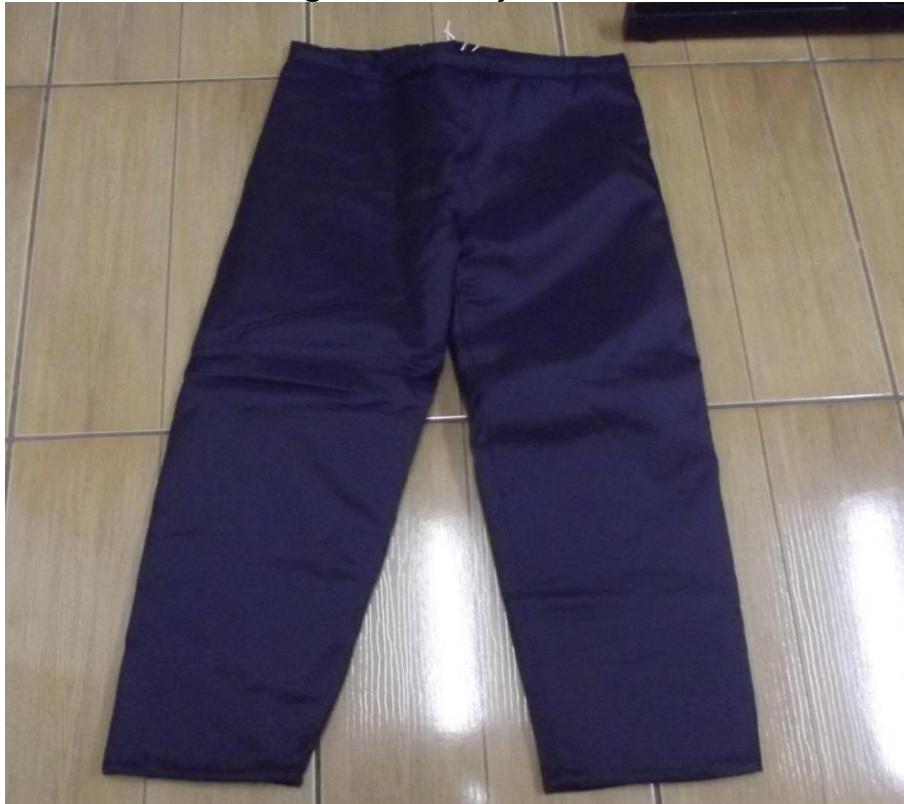
Figura 24 - Calça térmica