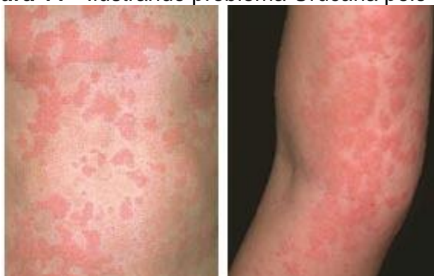
Figura 11 - Ilustrando problema Urticária pelo frio