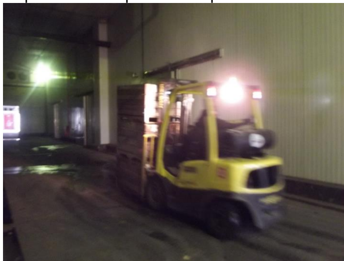
Figura 9 - Máquina utilizada para o transporte dos bins de maçãs