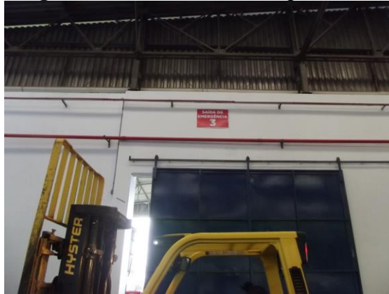
Figura 32 - Saída de emergência 03