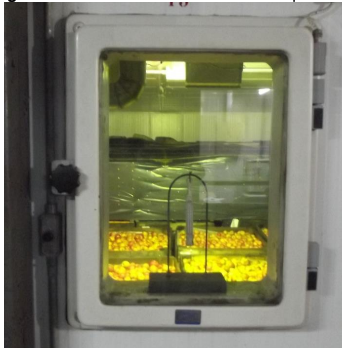
Figura 8 - Câmara com 100% de sua capacidade