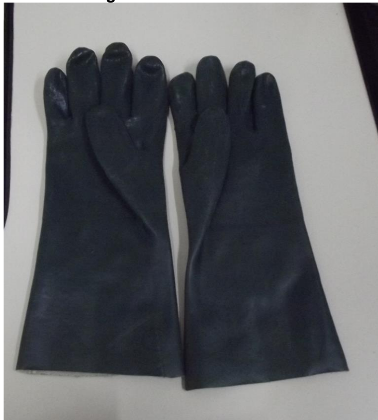
Figura 18 - Luvas Térmicas