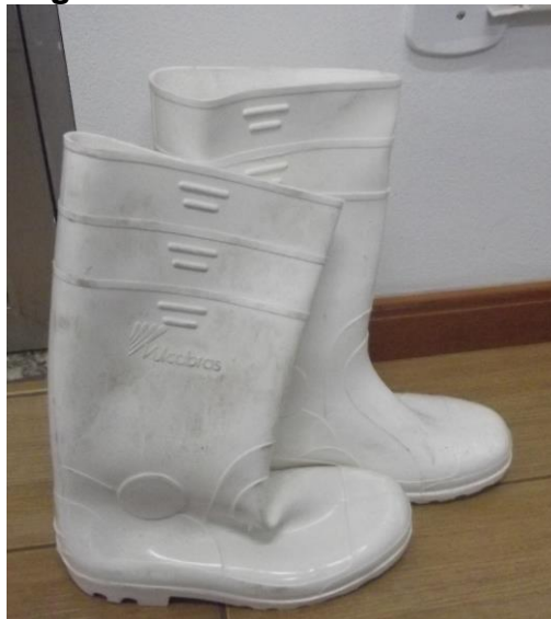
Figura 28 - Botas contra umidade