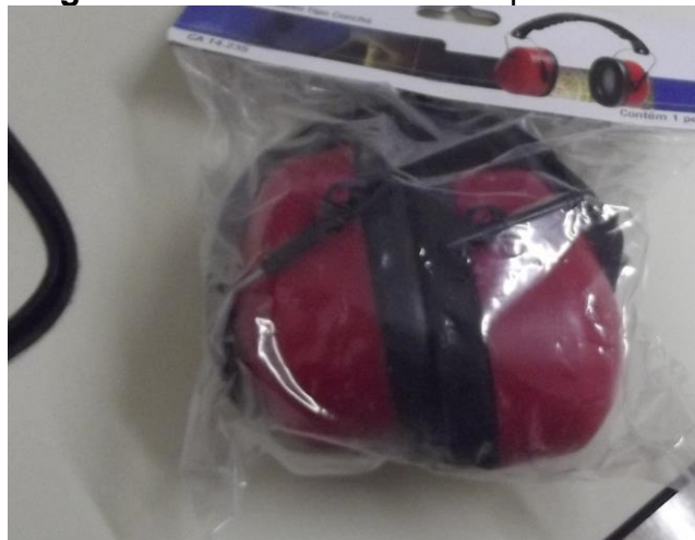
Figura 20 - Protetor auricular tipo concha