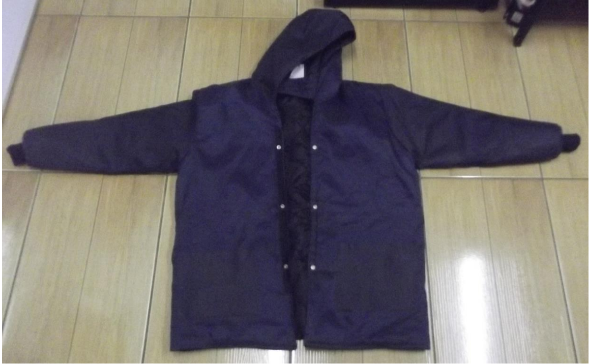
Figura 25 - Jaqueta térmica