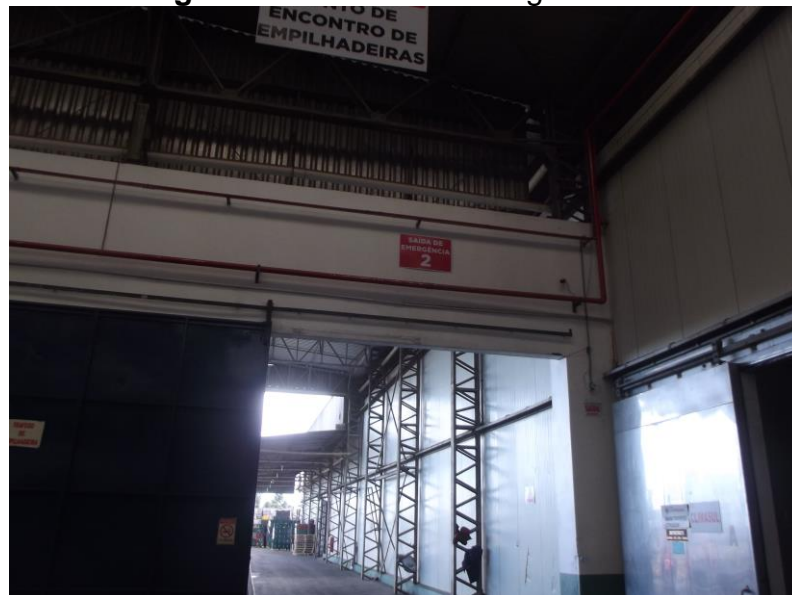
Figura 31 - Saída de emergência 02