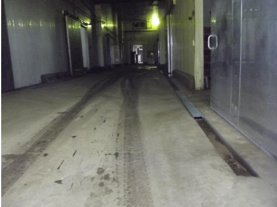
Figura 16 - Pisos não demarcados entradas das câmaras frias