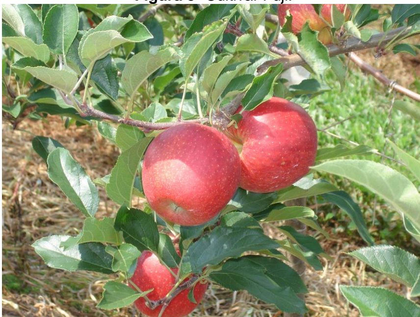
Figura 5- Cultivar Fuji.

O fruto é de tamanho médio a grande, (Figura 5), de cor esverdeada tornando-se amarelo – claro quando próximo da maturação, firme, crocante, muito suculenta de sabor doce e agradável. Os frutos apresentam alta incidência de “pingo de mel”. Quanto à conservação em câmara fria, a Fuji pode ficar até 11 meses, sem perder a qualidade. (BONETTI, RIBEIRO, KATSURAYAMA, 2006).